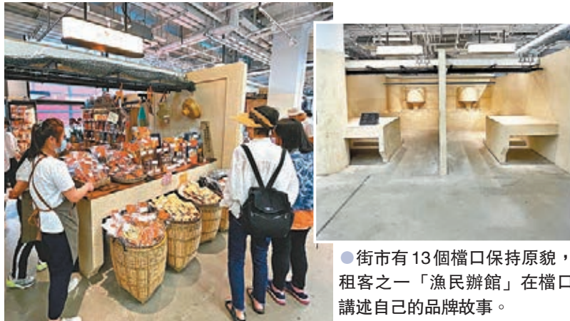
●街市有13個檔口保持原貌，租客之一「漁民辦館」在檔口講述自己的品牌故事。