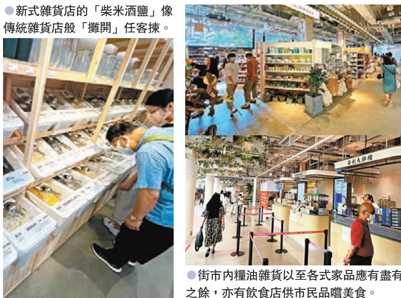
●新式雜貨店的「柴米酒鹽」像傳統雜貨店般「攤開」任客揀。