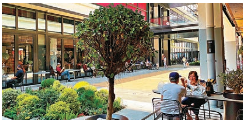
●街市設約100個座位，並提供無線網絡，市民可以隨意休息。