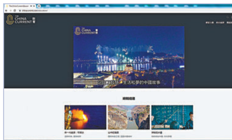
▲「The China Current」教育頻道設有15個學習主題，至今已有超過300條影片連文稿，超過50套教材，方便教師用於課堂教學或學生在課餘時間自學。