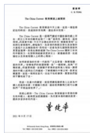
●董建華於賀信表示，今次教育頻道邁出新的步伐，相信一定會為深化國情教育提供更豐富選擇。

香港文匯報訊（記者 姜嘉軒）多名政界、法律界及教育界代表，昨日均對「The China Current」教育頻道啟動致以祝賀。全國政協副主席董建華在賀信中表示，讓香港的年輕人認同國家，了解燦爛的中華文明，教育至關重要，衷心期待頻道可充實本港的國民教育，加深香港學生和年輕人對國家的認識。香港中聯辦副主任譚鐵牛在賀信中表示，頻道有助增強同學的國家觀念，讓他們成為堅定捍衛「一國兩制」人才。 董建華在賀信表示，今次教育頻道邁出新的步伐，根據教育局公民科課程指引，為香港的教師及學生度身製作大量短片以及輔助教材，相信一定會為深化國情教育提供更豐富選擇。 他強調，如何使香港的年輕一代做到「立足香港、胸懷祖國、面向世界」，培養他們的家國情懷，是「一國兩制」能夠「行穩致遠」的重要保證，這事關乎香港前途與港人福祉。 譚鐵牛：助增學生對國家觀念 譚鐵牛在賀信表示，公民科旨在幫助學生建立正面的價值觀和積極的人生態度，培養學生成為具有國家概念、香港情懷和國際視野的新一代，新課程的開設只是第一步，要真正實現科目宗旨，還需要政府、學校以及社會各界共同努力。 他讚揚「The China Current」教育頻道為公民科製作了多份高質量的視頻資料和教學材料，從雄美壯麗的自然風景到巧奪天工的超級工程，從豐富多彩的傳統文化到日新月異的高新科技，提供了豐富而鮮活的國情與國民教育教材，希望師生好好利用，成為堅定捍衛