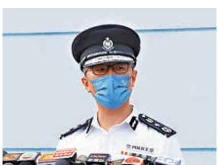
●蕭澤頤重申,任何團體如有可能違反香港國安法,警方都一定追究。