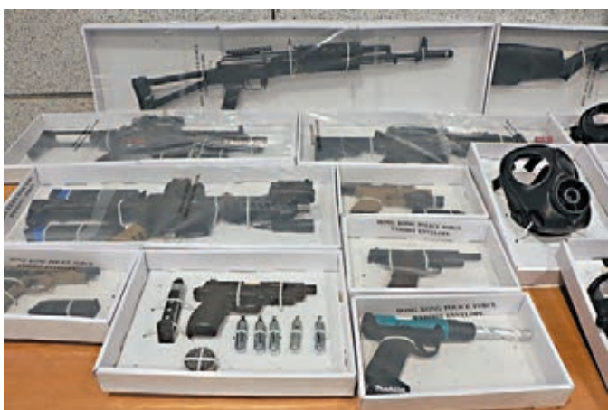
▶警方在行動中檢獲的長短仿製槍。

倉儲物櫃,檢獲9個軍用級防毒面具及6個濾罐、5支長槍及6支短槍的仿製槍械、兩部對講機、兩支伸縮棍、兩把摺刀、3個V煞面具及護具等。