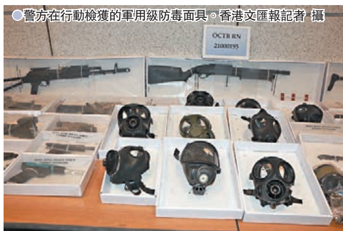
●警方在行動中檢獲的軍用級防毒面具。

有組織罪案及三合會調查科警官陳昕昨日表示,雖然暫時未有證據顯示案件與今日香港選舉委員會界別分組選舉有關,但警方所檢獲的違法物品中,大部分於過去修例風波期間曾經被黑暴分子廣泛使用,加上近期曾發生「孤狼式」恐襲