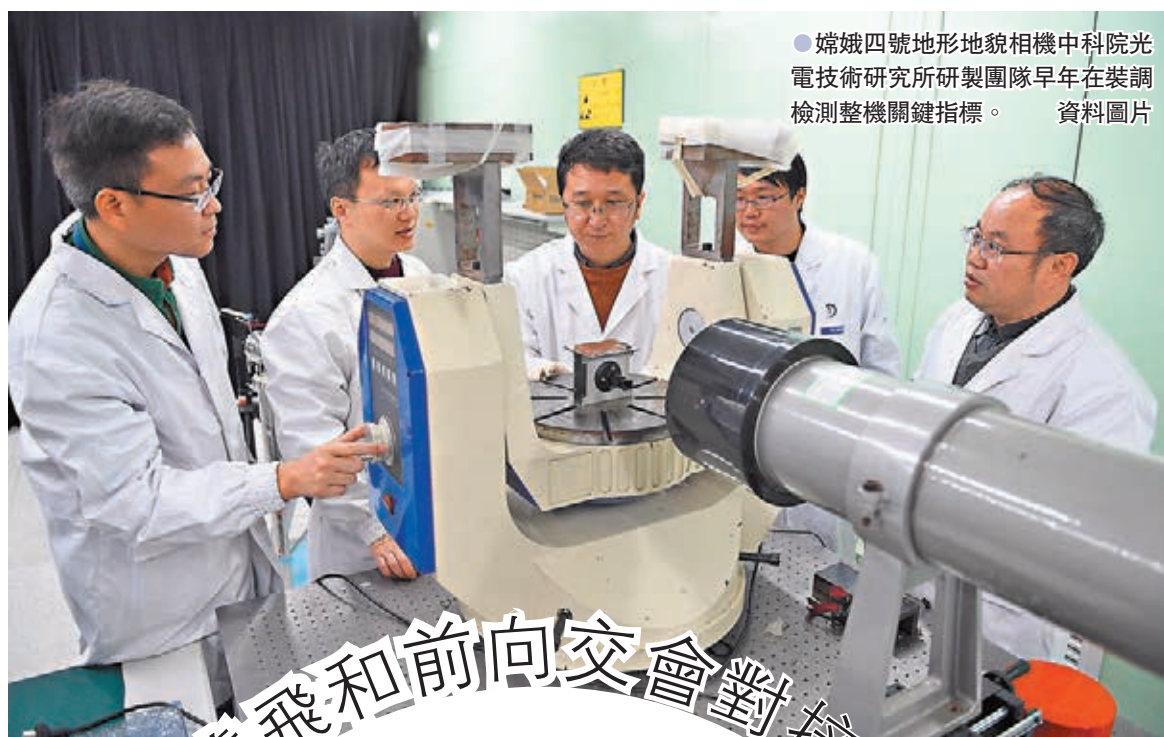
●嫦娥四號地形地貌相機中科院光電技術研究所研製團隊早年在裝調檢測整機關鍵指標。

對於中國載人航天未來的計劃，高銘表示，太空站將運行十年以上，可以工作到2035年左右。與此同時，中國正在持續開展載人月球探測方案的深化論證，相關研究工作正穩步推進，不遠的將來將會實現載人登月，長遠的目標是建立月球基地。在更加遙遠的未來，希望能將載人空間探測推向更加遙遠的深空。