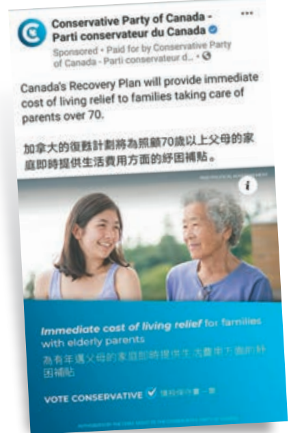
●保守黨的中文廣告拉攏華人選民。