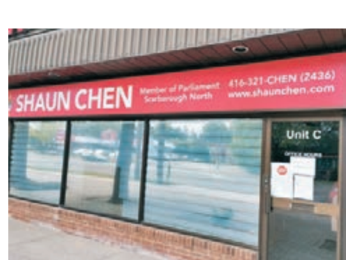
●到處都可看到少數族裔的現任議員辦事處(右)和候選人的宣傳板(左)。