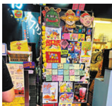
「黃店」內的「連儂牆」貼滿了支持黑暴的貼紙。