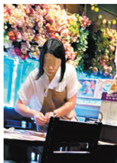
一名「黃店」侍應工作時未戴口罩。

要清潔店面的枱凳外，還需為客戶送餐。其間有顧客向其討要餐具之時，該職員更是直接放下抹布，轉身取得餐具遞之。該職員又不時將口罩拆下，只有在面對消費者的時候，才重新戴上。有顧客觀察到該職員的行為，不得不向同伴小聲質疑剛送上來的食物衛生狀況，「又除單，又周圍摸，（同時）又掂食物，我點吞落肚？」