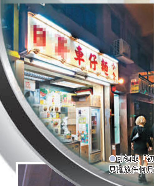
可領取「初心」月餅的聯營「黃店」未見擺放任何月餅。