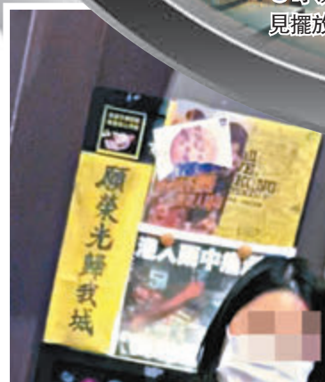
「黃店」內依然張貼着暗示支持黑暴的文宣。