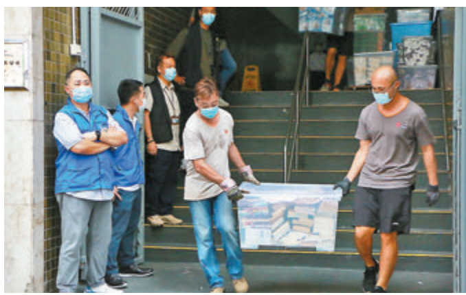
●國安處人員在貨倉檢獲40多箱證物。