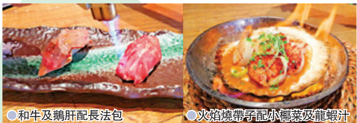
●和牛及鵝肝配長法包