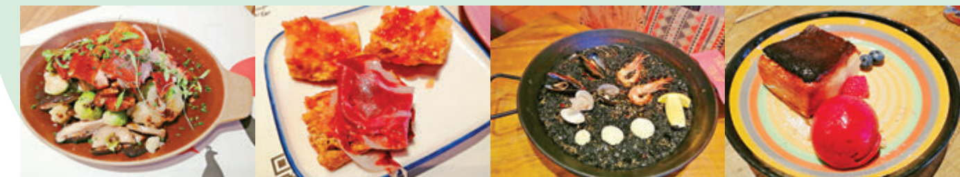
●慢煮烤乳豬配椰菜仔及蘑菇