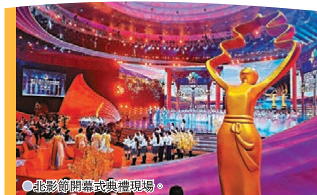
● 北影節開幕式典禮現場。