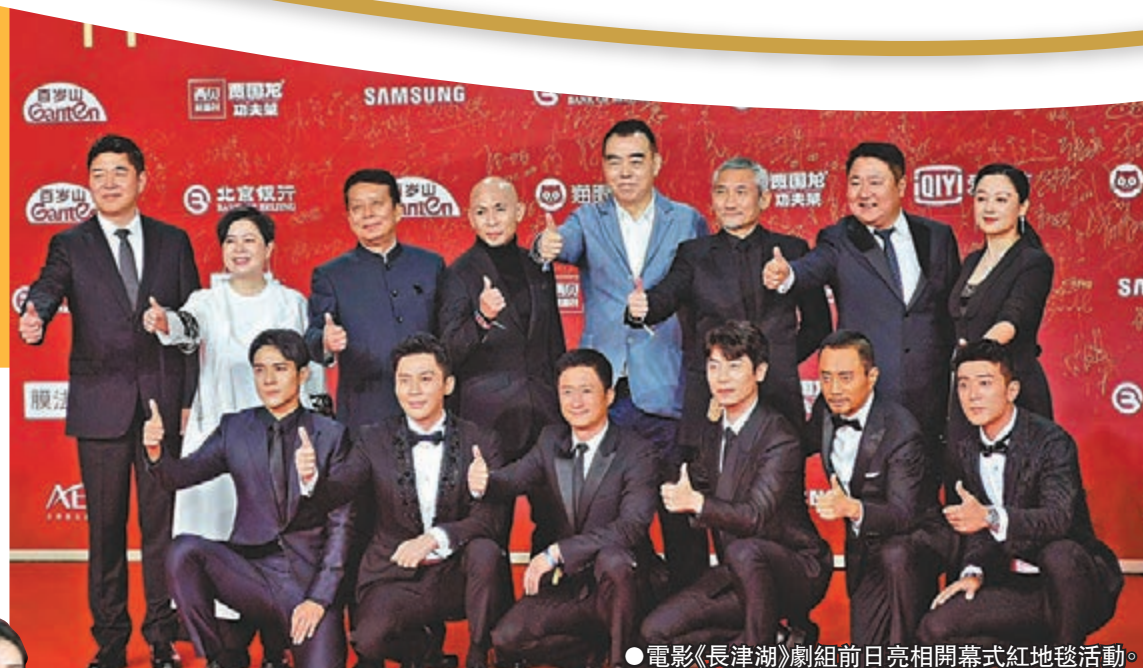
● 電影《長津湖》劇組前日亮相開幕式紅地毯活動。