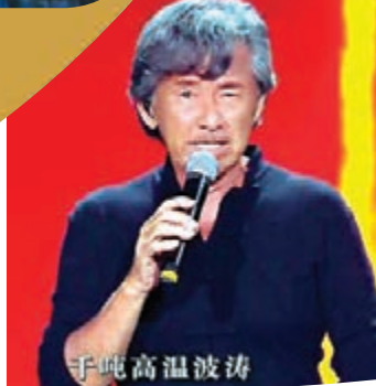
● 林子祥唱歌中氣十足。