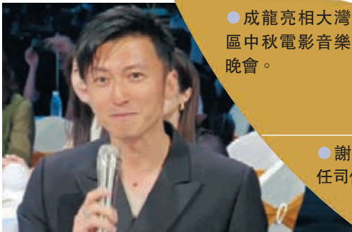
● 謝霆鋒鮮有擔任司儀。

香港電影的興起讓粵語歌曲成了無數歌迷、影迷心中最難忘的青春回憶和心靈慰藉。可以說，每個人心中都有一首粵語歌。大灣區中秋電影音樂晚會上，既有《男兒當自強》、《敢愛敢做》、《晚秋》、《一生何求》、《月半小夜曲》等經典粵語歌曲，反覆撥動人們記憶深處的那根心弦，更有承載着港人成長記憶的《麥兜與雞》和成為香港市民同舟共濟、奮發圖強象徵的《獅子山下》。