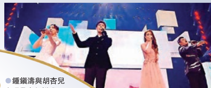
● 鍾鎮濤與胡杏兒合唱帶來新鮮感。