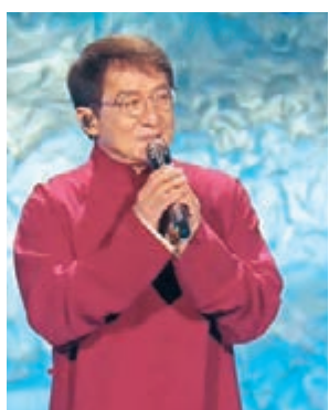
● 成龍亮相大灣區中秋電影音樂晚會。