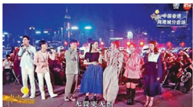
● 香港藝人在海港城分會場演唱《獅子山下》。