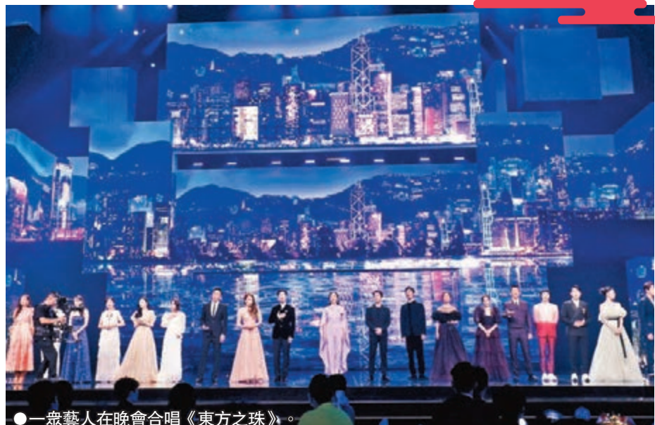
● 一眾藝人在晚會合唱《東方之珠》。