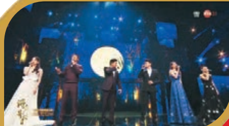
● 莫華倫、吳奇隆、戴佩妮、杜江、張小斐和歐陽娜娜合唱《但願人長久》。

輪到篇章二《情融大灣區》，王源獻唱《流動的青春》，由一班歌手如鍾鎮濤和胡杏兒合唱《一生何求》，趙雅芝、陳松伶、李若彤及溫碧霞唱《月半小夜曲》，劉燁和劉愷威合唱《晚秋》，莫華倫、吳奇隆、戴佩妮、杜江、張小斐和歐陽娜娜合唱《但願人長久》等「月亮組曲」。之後，黃曉明、容祖兒、張韶涵、劉乃奇合唱歌曲《國家》。至於篇章三《我的中國心》，有成龍唱出歌曲《民生》。最後，群星大合唱《我的中國心》，主會場的鍾鎮濤、任達華、舒淇、易烱千璽、關曉彤、劉昊然等聯同在香港會場的張明敏、譚詠麟、王祖藍、周勵淇、李亞男、方力申、周柏豪、許靖韻、陳明熹、羅鈞滿、趙汝承、炎明熹演出，將晚會氣氛推向高潮，觀眾在溫情洋溢的氣氛包圍下，度過愉快的中秋明月夜。