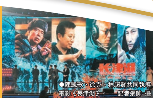
● 陳凱歌、徐克、林超賢共同執導電影《長津湖》。