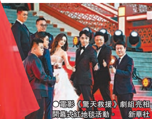
● 電影《驚天救援》劇組亮相開幕式紅地毯活動。