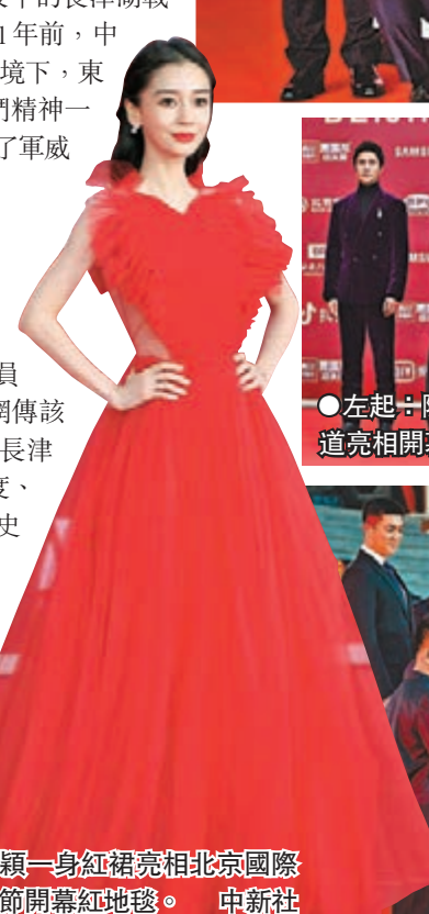
● 楊穎一身紅裙亮相北京國際電影節開幕紅地毯。

據悉，《長津湖》將於9月30日國慶前夕在全國公映。一場感動國人的壯烈戰役，一部製作精良的戰爭巨製，一支精銳盡出的電影團隊，在今年國慶檔，《長津湖》將用精彩絕倫的影像技術與先進的拍攝手段，帶領觀眾回到戰爭年代，沉浸式地體驗革命先輩們面臨的艱難險阻，體會新中國繁榮進步的來之不易。