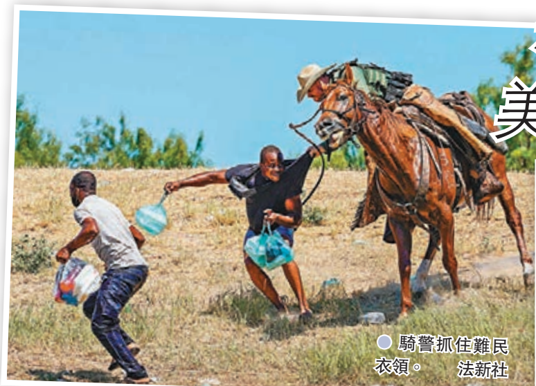
騎警抓住難民衣領。

在加拿大，少數黨執政年期平均只有兩年，杜魯多在某种程度上必須提早大選，才能延續自由黨的執政。疫情大流行是一個機會，讓杜魯多繼續執政，亦推動中間偏左政治力量再抬頭。