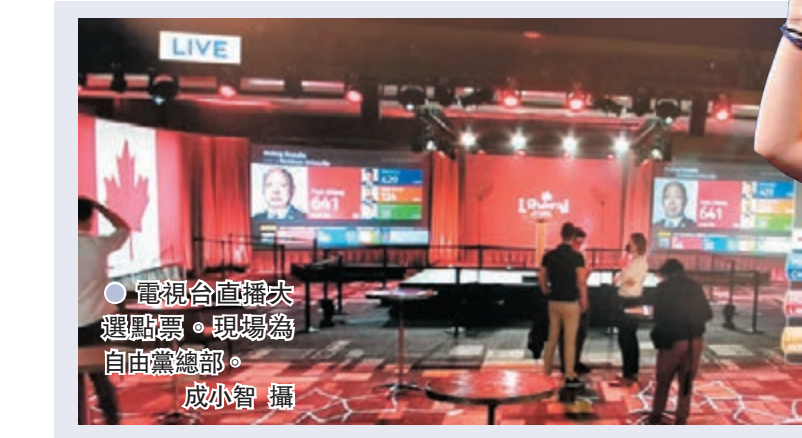
電視台直播大選點票，現場為自由黨總部。