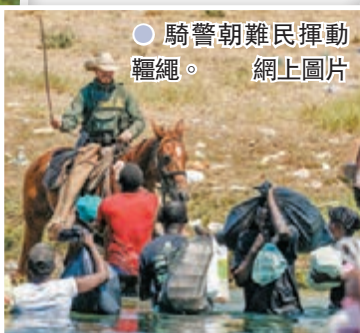
騎警朝難民揮動鞭子。