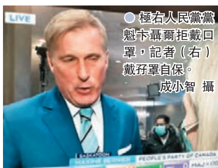
極右人民黨魁下聶爾拒絕戴回罩，記者（右）戴子單自保。