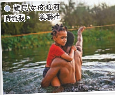
難民女孩渡河時流淚。

近1.6萬名海地難民近日湧入美墨邊境，美國邊境巡邏隊派出騎警沿邊境河岸巡邏。有現場片段顯示，得州騎警用類似長鞭的繩子阻攔難民，更有騎警在馬背上抓着難民衣服拖行，粗暴阻止其越過關卡，惹來各方批評。白宮發言人普薩基批評執法人員舉動不可接受，網上亦有評論指白人警察驅逐黑人難民，令人聯想到黑奴在美國的血淚史。