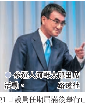
參選人河野太郎出席活動。

日本政府昨日在內閣會議上決定，將於10月4日召開臨時國會，選出新任首相，接替離任的菅義偉。