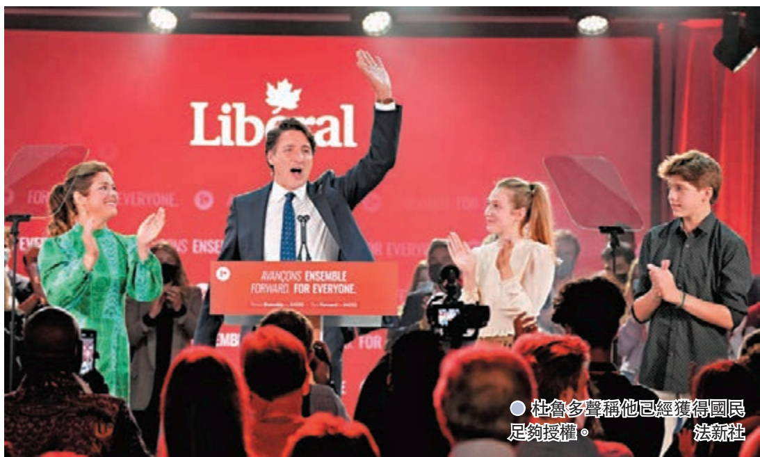
杜魯多聲稱他已經獲得國民足夠授權。

投票站在當地晚上9時半後陸續關閉，點票工作隨即展開，但由於有多達100萬郵寄選票需要在大選後翌日處理，最終結果可能要延後公布。