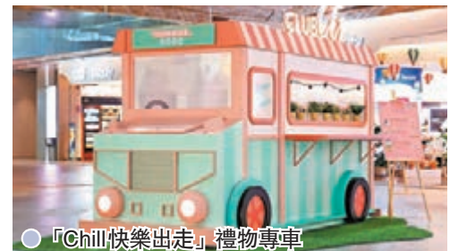
●「Chill 快樂出走」禮物專車

今個初秋，東薈城名店會與大家愜意出走，於香港上空體驗尊貴又別具品味的飛行旅程，讓你放下日常繁瑣，享受「飛」一般的消費禮遇！為慶祝 CLUB CG 一周年大日子，商場由即日起至 10 月 3 日呈獻「一周年 Chill 慶典」主題活動，一系列豐富禮遇讓會員開心玩樂購物外，同時體驗全港商場首推驚喜 Flycation 獎賞，更有「Chill 好戲美食賞」、季度新品獎賞換領，以及互動有獎遊戲，共度 Chill 玩樂時刻。而且，商場特別打造少女系的甜點車主題打卡裝置，車身以馬卡龍色調設計，配上亮閃閃燈光效，讓大家瞬間感受走出寫意氣息，還可大玩 3 個不同樂趣的數碼互動小遊戲，如挑戰「Chill 快樂出走」AR 濾鏡遊戲及模擬駕駛禮物專車收集棒棒生日蛋糕等，有機會贏取豐富獎品。