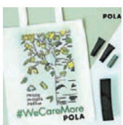
●LOVE POLA B.A 精華水慈善套裝

作為「為愛而生」的品牌，POLA 一直堅持將更多愛精神傳遞給身邊關愛的人、社會，希望能以生命影響生命，鼓勵下一代主動關心社會和地球，讓愛延續和邁向更美好的未來。所以，品牌努力保持積極正面的生活態度，與顧客分享超越時光、場地的關懷，提倡「We Care More」的品牌新概念，將愛分享給世界，於今個月品牌的誕生月，特別推出「LOVE POLA B.A 精華水慈善套裝」，套裝包括了品牌的 B.A 精華水及 B.A 體驗套裝，以及印有 POLA × 香港女童群益會兒童繪畫比賽冠軍作品的環保袋，而每套慈善套裝亦會捐出 $100 予香港女童群益會作本地兒童發展基金用途。