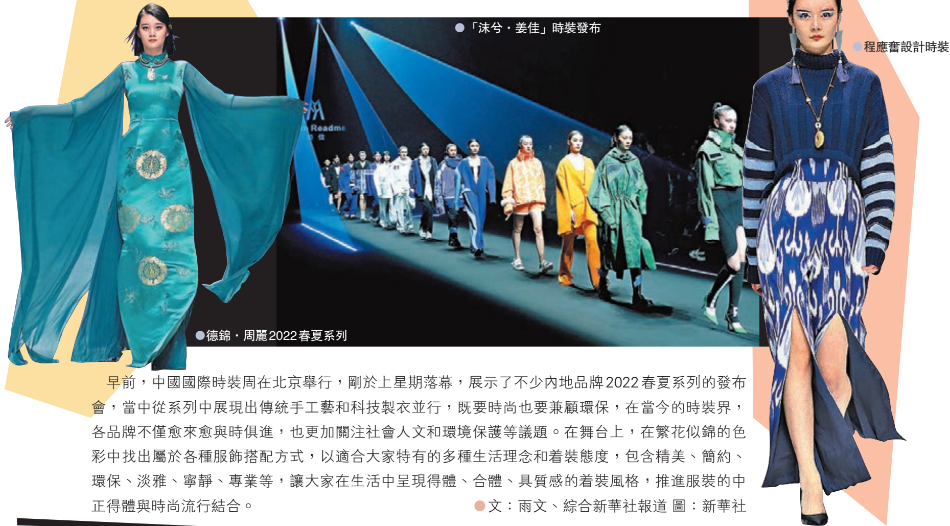
●「沫兮·姜佳」時裝發布