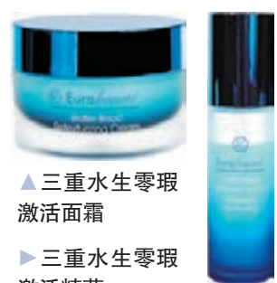
▲三重水生零瑕激活面霜 ▶三重水生零瑕激活精華

人要飲水，肌膚也一樣，Eurobeauté 推出全新「三重水生零瑕激活系列」，帶你進入爆水新世紀，系列特別應用Triple-Boost Complex × 三重爆水激活配方，2步引爆自生水循環，激活膠原合成、重建儲水庫，「爆」升肌膚水分，幫你「補水」再「保水」，10秒極速吸收爆水成分，締造零瑕水晶肌。