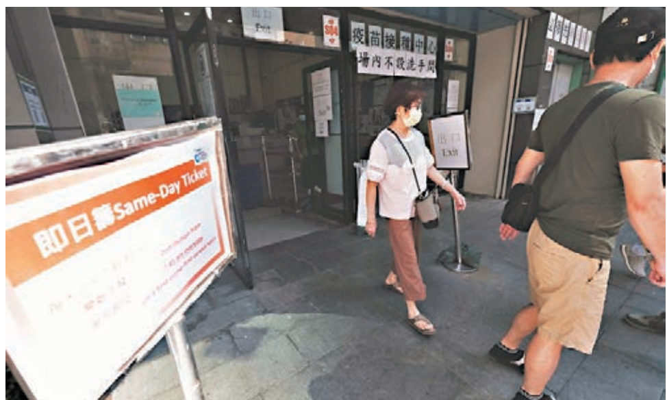
●「即日籌」安排昨起擴展至所有合資格者，有市民趁放假前往打針。

特區政府發言人強調，復必泰和科興疫苗均對預防新冠肺炎重症和死亡情況高度有效，呼籲仍未接種疫苗的市民，特別是感染新冠病毒後死亡風險極高的長者、長期病患者及其他免疫力較弱者為自己健康着想，在本港第五波疫情來臨前盡快接種疫苗。