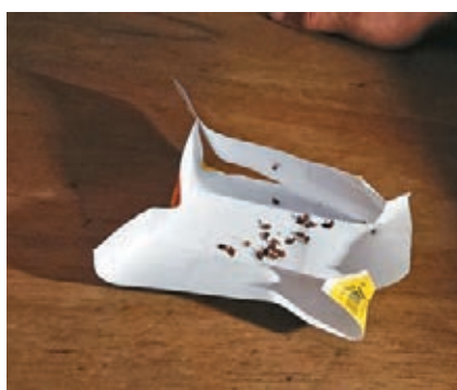
▲臨時收容中心出現蟲患，影響住戶健康及令人難以入睡。