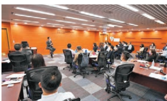
●聶德權在課程中出席分享指，需要公務員走入群眾，掌握民情，適切落地。

香港文匯報訊（記者 鄭治祖）為配合高級公務員發展，培養具潛質出任首長級的人員成為公共行政領袖，共36名公務員近日參加了為期三周的「公共行政領袖實踐課程」。公務員事務局局長聶德權亦有在課程中出席分享，並於昨日在Facebook發文表示，公共政策服務於人，由人出發，需要他們走入群眾，掌握民情，適切落地。