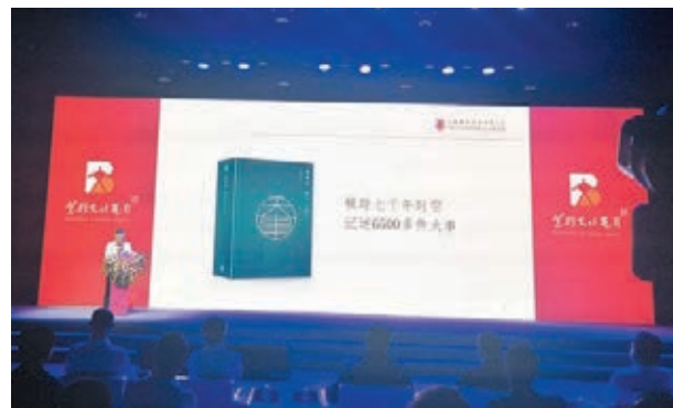
●《香港志》首冊《總述 大事記》將亮相第十七屆文博會。

連線成員陳偉雄指出，收容中心只有風扇沒有空調設備，住戶在夏天難以入睡，且中心住戶之中亦有學生，惟中心卻缺乏無線上網設備，導致學生無法正常學習。他建議房署加快「無家可歸」評審進度；在設施失靈時盡快安排維修或更換；在中心增添冷氣和Wi-Fi服務。他說，政府現時只為因清拆工廈而受影響的住戶提供搬遷津貼，建議政府為所有因執法行動被迫搬遷的人士提供相同津貼，以減輕他們的生活困難。