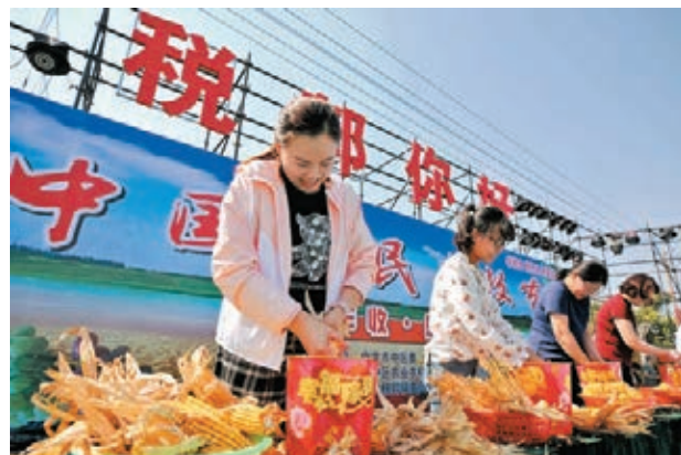
●9月22日，山東省棗莊市稅務局舉辦「趣味賽 慶豐收」活動，參賽隊員通過運糧、搓玉米、吃西瓜等趣味比賽，感受豐收的喜悅，迎接中國農民豐收節。

轉向全面推進鄉村振興。各級黨委和政府要貫徹黨中央關於「三農」工作的大政方針和決策部署，堅持農業農村優先發展，加快農業農村現代化，讓廣大農民生活芝麻開花節節高。 中國農民豐收節是第一個在國家層面專門為農民設立的節日，於2018年設立，節日時間為每年「秋分」。