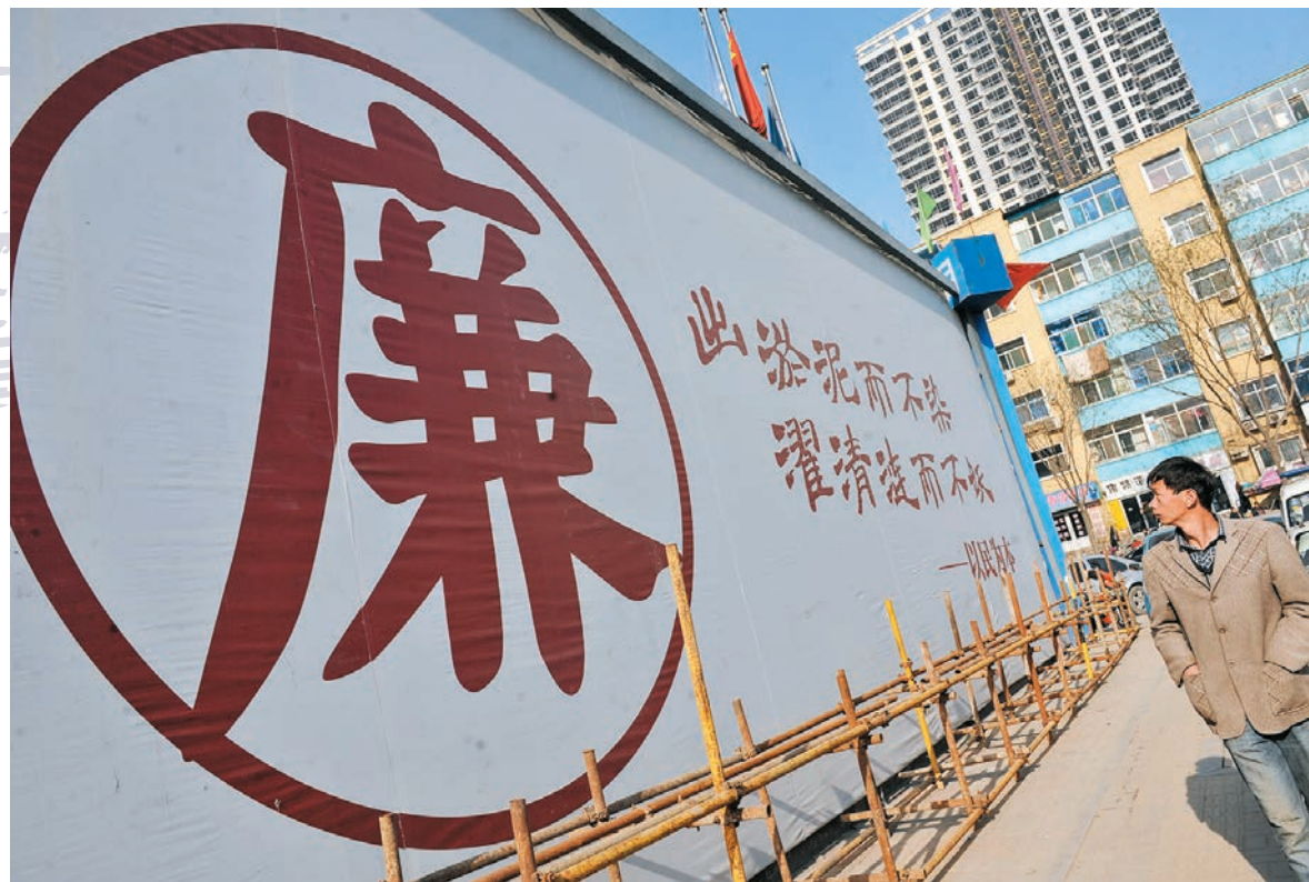
●山西太原，民眾從廉政公益廣告前經過。