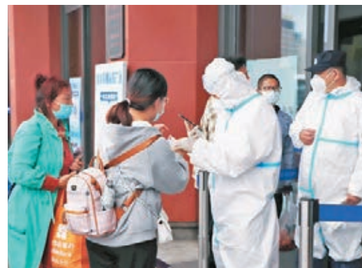
●9月22日，哈爾濱西站，工作人員檢查旅客是否持有48小時內核酸檢測陰性證明。

聞發布會，21日18時至22日16時，哈爾濱市新增新冠肺炎確診病例8例，巴彥縣7例，南崗區1例，另有3例由重點人群篩查陽性轉為確診病例。以上人員均係21日3例確診病例的密切接觸者。