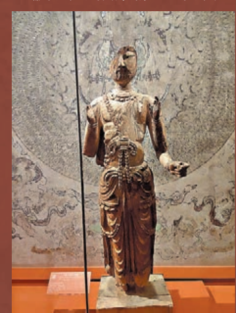
● 北宋木雕八臂觀音殘像。