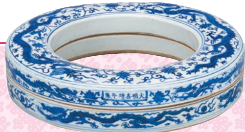
● 明嘉靖青花龍紋朝珠環形蓋盒款式

根據《江西宏願·陶書》一書，「舊陂塘青產於本府樂平一方，嘉靖中，樂平格殺，遂塞。石子青產於瑞州諸處。回青行，石子遂廢。」由此可知，嘉靖期間景德鎮曾用過3種青花料，即樂平的陂塘青、瑞州的石子青及西域的回青。因此，嘉靖前期採用的陂塘青發色鮮亮，有成化之風；而使用石子青的瓷器與正德晚期發色類似，青花呈黑藍色，色澤深沉灰暗，有暈散現象；最具嘉靖朝特點的青花採用回青料，鈷料主要為官窯所用，由官府專門保管。 然而，書中亦提及：「回青淳，則色散而不收；石青多，則色沉而不亮。每兩加青一錢，謂之上青；四六分加，為當中青。中青用以設色則筆路分明；上青用以混水則顏色清亮。」可見嘉靖期間官窯青花會摻雜回青及江西的石子青使用，使得呈色介於紫藍與灰藍之間，只有經過準確的配比，才能得到發色濃翠、藍中泛紫、