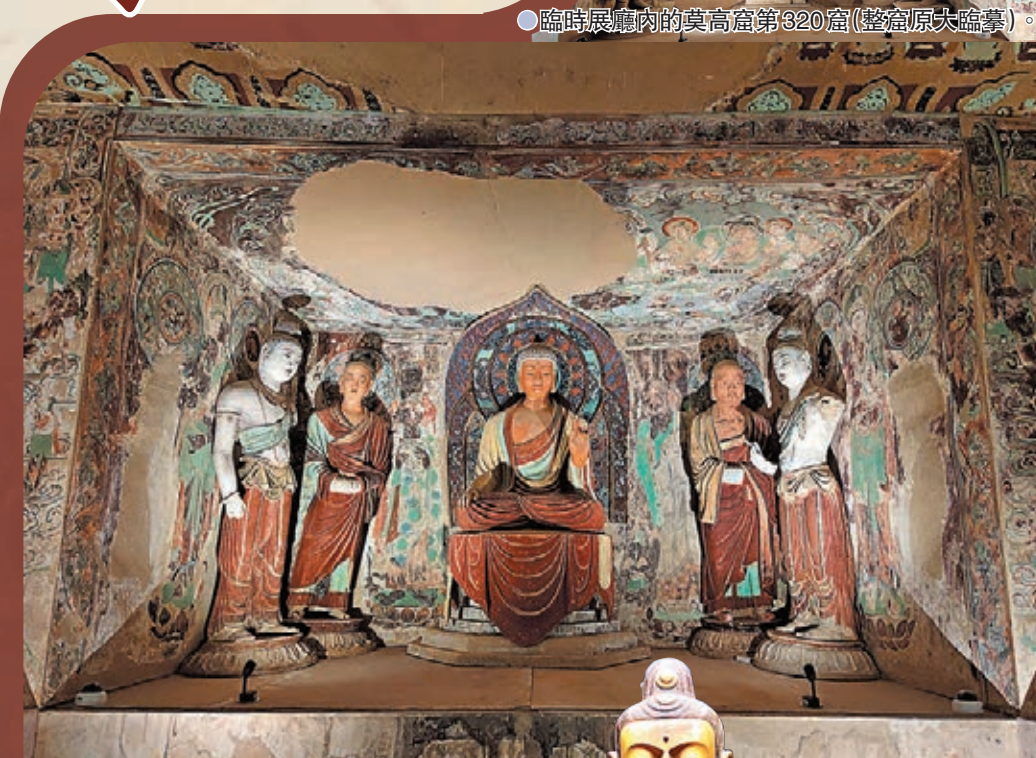
● 臨時展廳內的莫高窟第220窟內景（整窟原大臨摹）。

展覽特意做了一種「圖、物對應」，即根據敦煌壁畫中的形象在文物中尋找對應的實物。如敦煌石窟220窟北壁樂師經變中出現的一件樂器——方響，現場就展出了一件故宮博物院藏的方響。