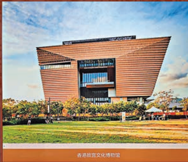
● 現場展示了香港故宮文化博物館外景圖片。