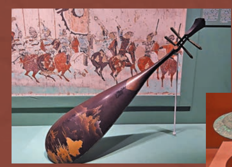
● 清代黑漆描金山水人物紋琵琶。