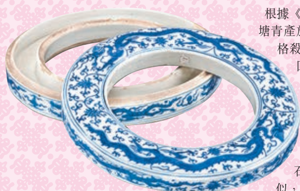
● 明嘉靖青花龍紋朝珠環形蓋盒

根據《江西宏願·陶書》一書，「舊陂塘青產於本府樂平一方，嘉靖中，樂平格殺，遂塞。石子青產於瑞州諸處。回青行，石子遂廢。」由此可知，嘉靖期間景德鎮曾用過3種青花料，即樂平的陂塘青、瑞州的石子青及西域的回青。因此，嘉靖前期採用的陂塘青發色鮮亮，有成化之風；而使用石子青的瓷器與正德晚期發色類似，青花呈黑藍色，色澤深沉灰暗，有暈散現象；最具嘉靖朝特點的青花採用回青料，鈷料主要為官窯所用，由官府專門保管。 然而，書中亦提及：「回青淳，則色散而不收；石青多，則色沉而不亮。每兩加青一錢，謂之上青；四六分加，為當中青。中青用以設色則筆路分明；上青用以混水則顏色清亮。」可見嘉靖期間官窯青花會摻雜回青及江西的石子青使用，使得呈色介於紫藍與灰藍之間，只有經過準確的配比，才能得到發色濃翠、藍中泛紫、