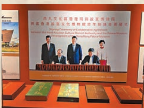
● 現場展示了習近平主席在香港西九文化區出席《興建香港故宮文化博物館合作協議》簽署儀式的照片。

故宮博物院與敦煌研究院作為並蒂相契的文化守望者，共同見證了中國文物事業的不凡發展歷程。值得注意的是，在展覽第三單元「保護傳承」部分，以珍貴檔案、影像、文獻及文物為載體，展現黨和國家的領導與關懷下，故宮博物院與敦煌研究院兩大世界遺產保護管理機構在新中國成立前後不同階段進行的文物保護研究與文化傳承弘揚工作及取得的重要成績。