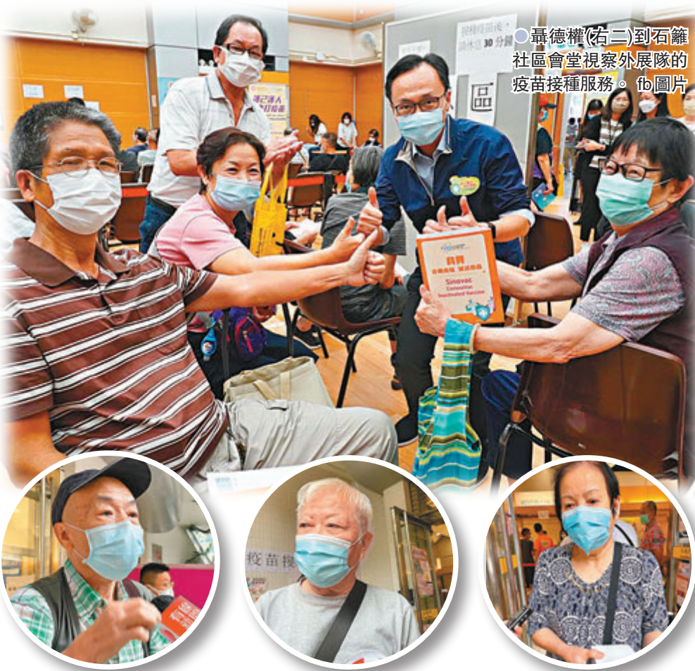
●顏先生 香港文匯報記者 攝