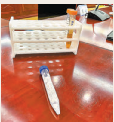
●人工合成澱粉實物。

研究人員表示，該成果為從二氧化碳到澱粉生產的工業車間製造打開了一扇窗，如果未來該系統過程成本能夠降低到與農業種植相比具有經濟可行性，將可能會節約90%以上的耕地和淡水資源，促進碳中和的生物經濟發展，推動形成可持續的生物基社會。