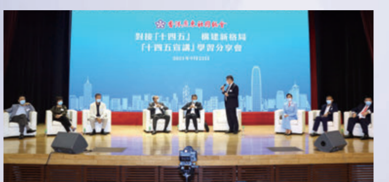
▲黃俊康與梁振英就如何把握雙循環機遇進行交流。