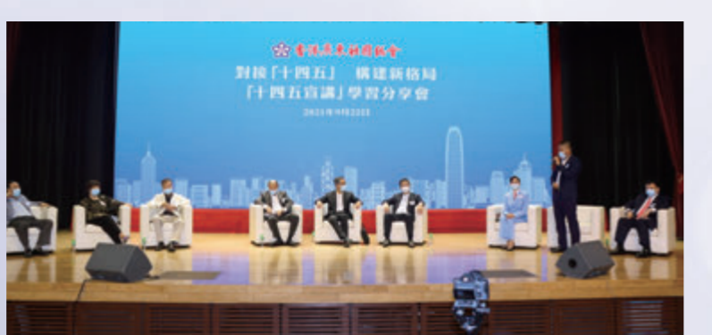
▲黃少康與梁振英就如何把握雙循環機遇進行交流。