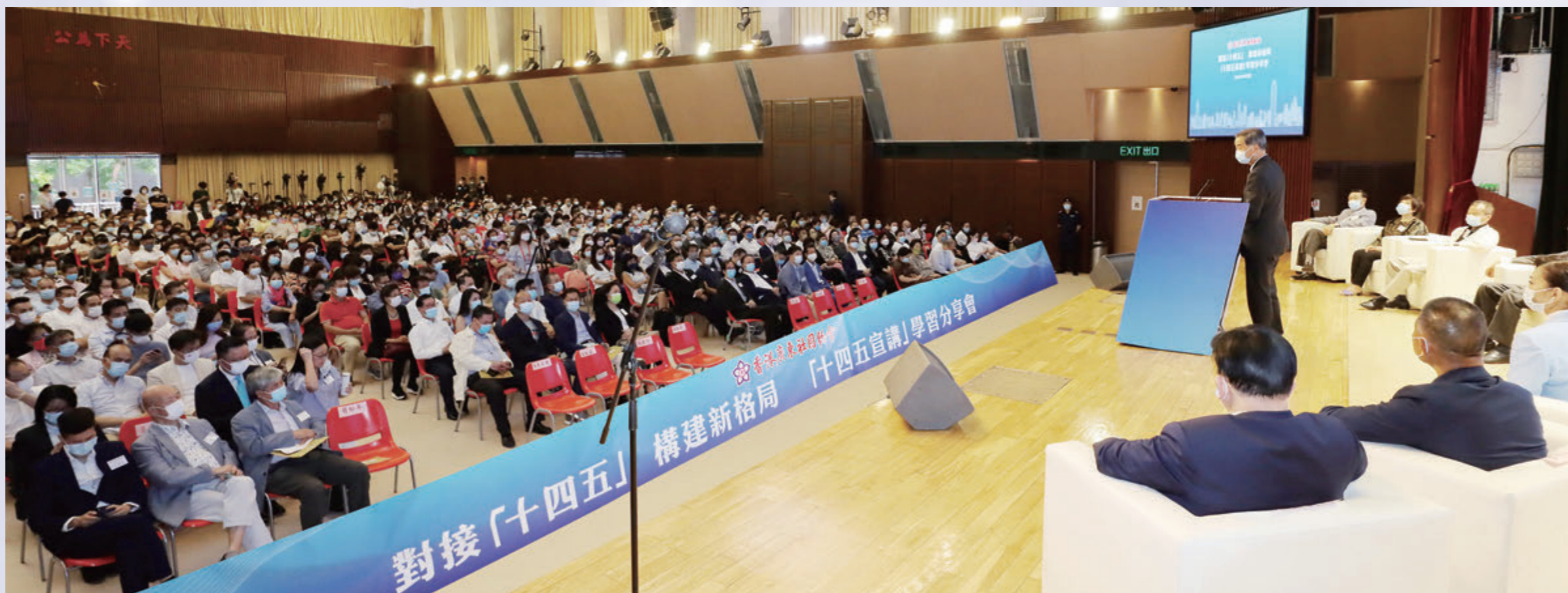
▲香港廣東社團總會成功主辦「對接『十四五』構建新格局」學習分享會