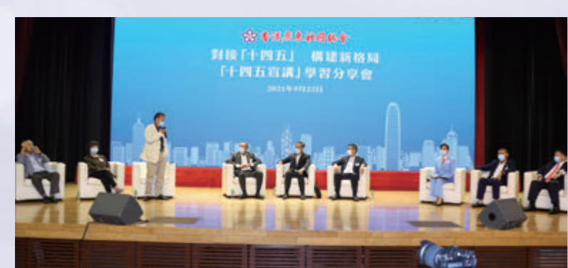
▲張國榮與梁振英就中央政府近日接連發布「橫琴方案」和「前海方案」進行交流。

鄧清河在致歡迎辭時表示，「十四五」規劃宣講團規格極高，由國務院港澳辦、國家發展和改革委員會、科技部和中國人民銀行等多個部門組成。而隨着國家「十四五」規劃的實施、2035年遠景目標的確立，香港正面臨新一輪、歷史性發展機遇，必須要牢牢抓住。這些文件，不僅是經濟藍圖，更是行動綱領，是中國未來進一步改革開放的取向。他殷切希望與會鄉親能夠多聽、多學，並積極向其他會員及親友解釋和宣傳。