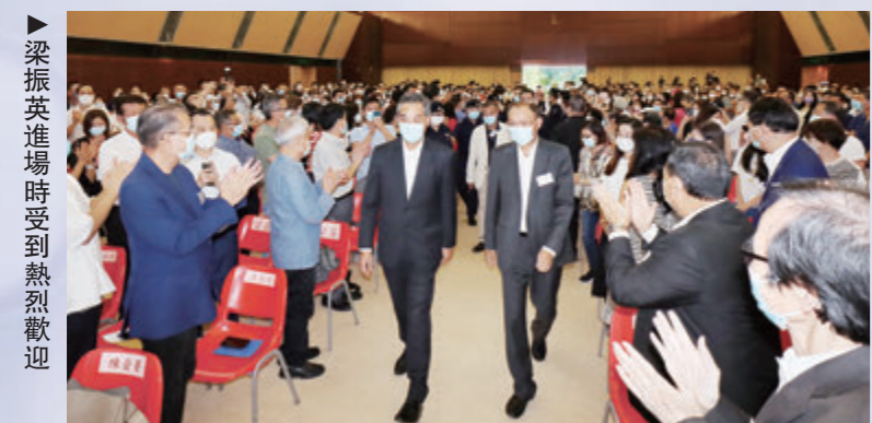
▲梁振英進場時受到熱烈歡迎

中央早前派出「十四五」規劃宣講團來港宣講國家「十四五」規劃，體現了中央對香港的親切關懷和大力支持。中聯辦主任駱惠寧出席國家「十四五」規劃宣講會致辭時指出，「十四五」規劃再次明確了香港發展新定位，並給予更多政策支持，現在需要香港社會進一步行動起來。為響應認清國家規劃要求，推動香港市民把握《「十四五」規劃綱要》的發展方向，香港廣東社團總會(下稱「總會」)於9月22日假尖沙咀街坊福利會舉行「『十四五』宣講」學習分享會，邀請到全國政協副主席梁振英擔任主講嘉賓，向總會董、廣總十區分會各級負責人分享國家「十四五」規劃，以期將香港未來的角色定位及融入國家發展大局而帶來的各種機遇，透過分享，帶入全港各區。