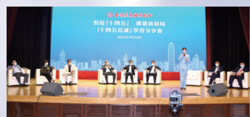
▲鄭美雲與梁振英就對接「十四五」規劃最好的方法進行交流。