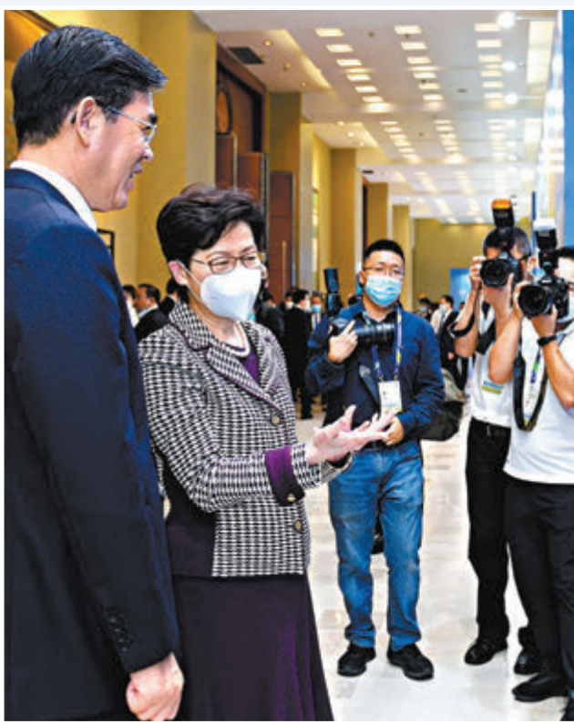
●林鄭月娥(左二)與貴州省省長李炳軍(左一)參觀有關會議的圖片展。

在文化方面，林鄭月娥表示，泛珠內地九省區加上香港和澳門各自擁有獨特文化底蘊，可增強彼此文化連通，做好中華文化傳承。特區政府自2019年起在內地舉行「香港周」，讓內地民眾認識香港文化藝術團體和世界級創意人才，她表示期望日後可到泛珠各個省區舉辦「香港周」活動，亦邀請泛珠省區文化組織來港舉辦綜合性文藝演出、展覽、食品推介等活動，深化民心相通和文化交流。