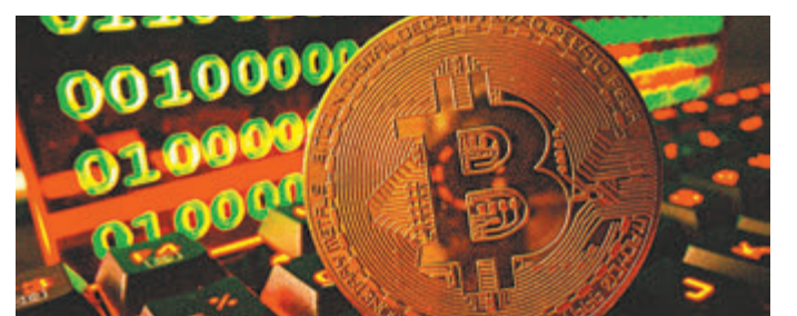
●內地要求金融機構和非銀行支付機構要加強對涉虛擬貨幣交易資金的監測工作。

國家發改委等部門同日發布關於整治虛擬貨幣「挖礦」活動的通知，全面梳理排查虛擬貨幣「挖礦」項目，嚴禁以數據中心名義開展虛擬貨幣「挖礦」活動，嚴禁對新建虛擬貨幣「挖礦」項目提供財稅金融支持。不允許虛擬貨幣「挖礦」項目以任何名義參與電力市場，已進入電力市場的虛擬貨幣「挖礦」項目限期退出。