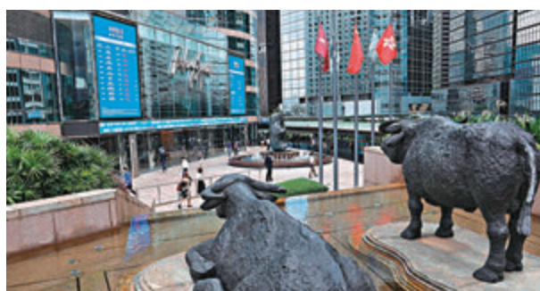
●德勤中國輕微下調今年本港新股市場預測，預料全年有110隻至120隻新股上市，集資規模近4,000億元。

外電消息指，社交媒體平台新浪微博已提交在港第二上市申請，集資最多10億美元。瑞信、中信里昂及高盛正就有關上市計劃展開工作。