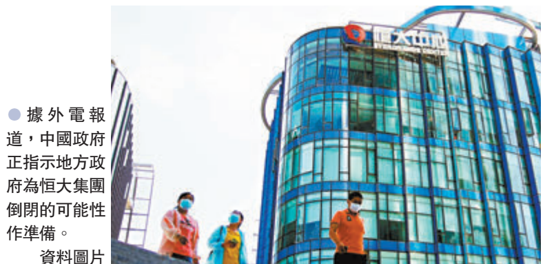
●據外電報道，中國政府正指示地方政府為恒大集團倒閉的可能性作準備。 資料圖片

香港文匯報訊(記者 莊程敏) 中國恒大(3333)債務問題持續困擾市場，原定前日(23日)需支付8,350萬美元債券利息，惟集團卻未有表示，也無跡象表明債券持有人取得利息，市場觀望債券30天寬限期。再加上恒大電動汽車業務員工傳出欠薪消息，以及傳中央正指示地方政府為恒大倒閉的可能性作準備，昨日恒大受壓，恒股價再插水11.61%，收報2.36元，