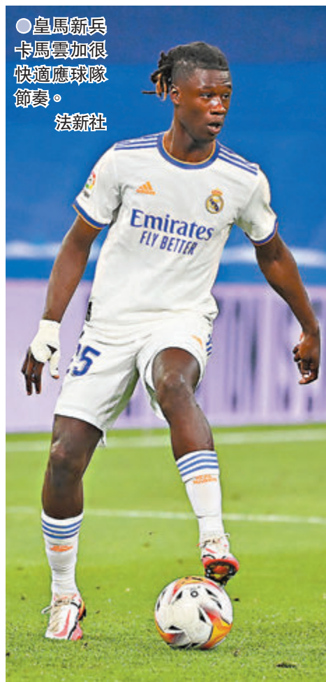
●皇馬新兵卡馬雲加很快適應球隊節奏。