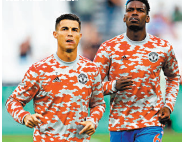
●C朗(左)和普巴對曼聯十分重要。

香港文匯報訊(記者 楊浩然)剛在聯賽盃出局的曼聯，今晚在C朗拿度和保羅普巴回歸正選下，主場該可擊退阿士東維拉。(now622台今晚7:30p.m.直播)