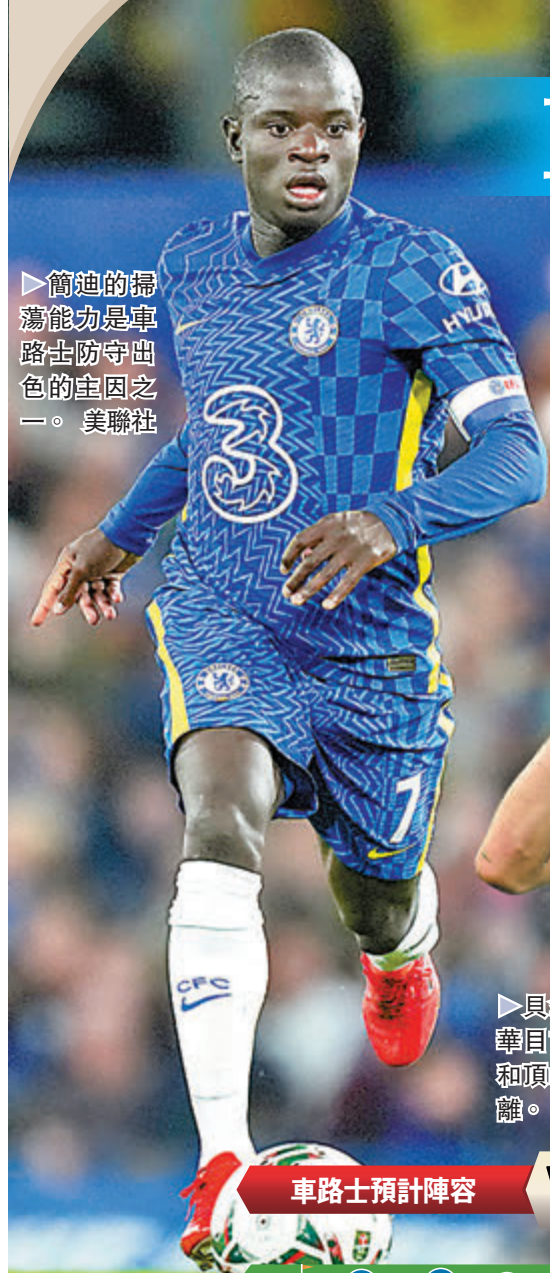
簡迪的掃蕩能力是車路士防守出色的主因之一。