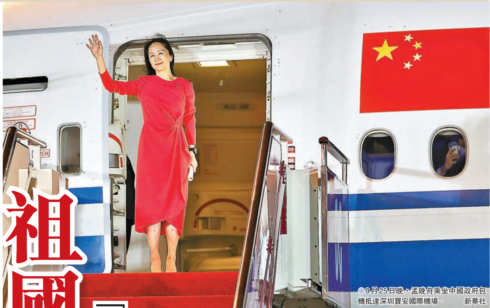
●9月25日晚，孟晚舟乘坐中國政府包機抵達深圳寶安國際機場。