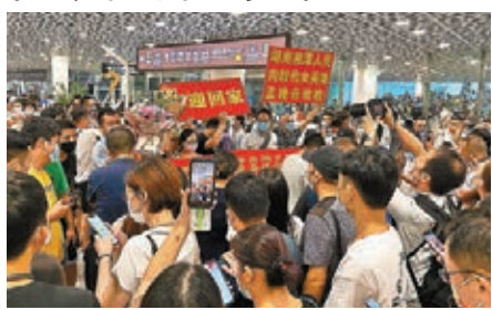
●大批市民在深圳機場歡迎孟晚舟回家。