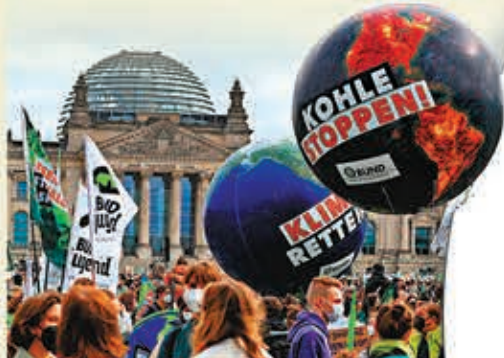
●柏林日前舉行有關全球暖化的大型集會，為綠黨增強聲勢。