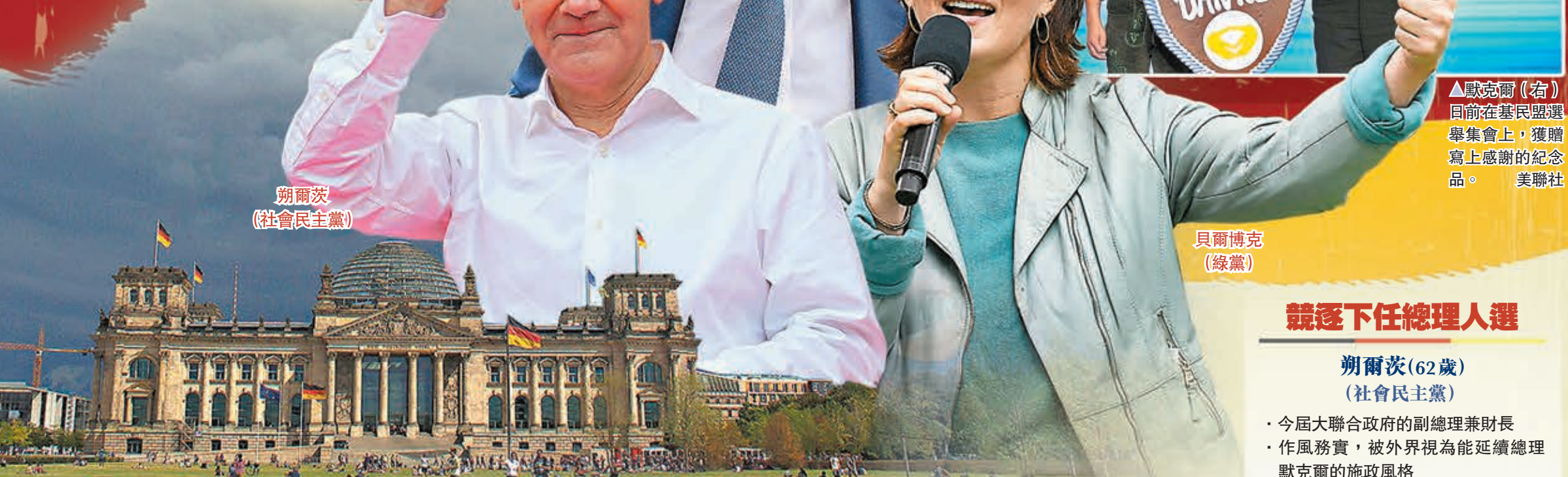
朔爾茨 (社會民主黨)

德國今日舉行大選，執政16年的總理默克爾不再尋求連任後將告別政壇，德國正式踏入「後默克爾時代」。對不少選民而言，今屆大選沒有默克爾這個「總理當然選擇」，政壇變得更碎片化，選前民調亦顯示兩大政黨支持度拉緊，德國聯邦政府可能出現歷來首個三黨執政聯盟。事實在歐洲政治舞台，多黨分享權力屬於常態，有專家認為可讓政黨更專注改善表現，不過亦有聲音憂慮多黨執政聯盟會妨礙施政，政府政策走向更不明朗，令政局更不穩。