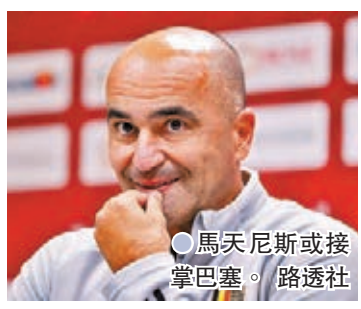
馬天尼斯或接掌巴塞。

事實上高文離任巴塞其實只是時間問題，有西班牙媒體指他和一眾巴塞球員的理念已越走越遠；消息指高文在美斯出走、球隊又未能大手筆引援下，只把今季目標定在取得來季歐聯資格，但據報巴塞主力如碧基和沙治羅拔圖，對高文的看法感到不高