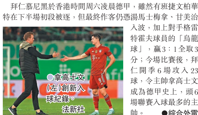
拿高士文(左)創新入球紀錄。

拜仁慕尼黑於香港時間週六凌晨德甲，雖然有班捷文柏華特在下半場初段被逐，但最終作客仍憑湯馬士梅拿、甘美治入波，加上對手格蕾特霍夫球員的「烏龍球」，贏3:1全取3分；今場比賽後，拜仁開季6場攻入23球，令主帥拿高士文成為德甲史上，頭6場聯賽入球最多的主帥。