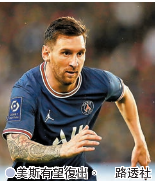
美斯有望復出。

據法國《隊報》報道，早前受傷的阿根廷球星美斯，昨日已開始和隊友一起訓練，在傷勢恢復良好下，有望在本周中對曼城的歐聯比賽復出。教練普捷天奴在記者會亦證實了有關消息，但同時表明雖然希望美斯在對曼聯時落場，但球隊會視乎美斯的狀態進度作最終決定。