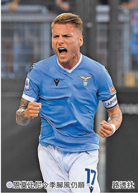
恩莫比尼今季腳風仍順。

同日其餘比賽，近3戰得2勝1和，有復甦跡象的祖雲達斯，主場對剛慘吃拿破里「4蛋」的森多利亞預計有分力爭勝(now638台今晚6:30p.m.直播)。至於尾場出擊的拿破里今季表現搶鏡，聯賽至今5出5捷是唯一保持全勝的球隊，是役主場對4戰3負的卡利亞里，相信聯賽6連捷在望。(now638台週一2:45a.m.直播)