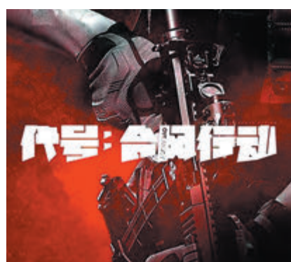
● 《代號·颱風行動》是以大灣區真實案件為背景的犯罪動作片。

他同時向導演們求片約:「請多給我們年紀大的男演員一些新的機會吧,請給我們多一些好的角色,給我們這些演員去演戲吧。」