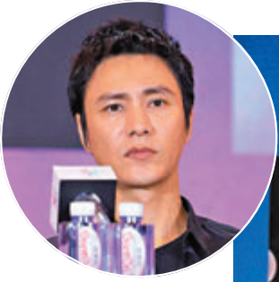
● 陳坤懇請導演們給大齡男演員多一些好的角色。

香港文匯報訊 第十一屆北京國際電影節(北影節)北京市市場簽約儀式前日(25日)如期舉行,現場宣布結果,今年共有44個重點項目、39家企業在北京市市場簽約發布,總金額達到352.23億元(人民幣,下同),同比增長約6%,再次突破紀錄,實現大豐收。另外,鞏俐、陳坤、張頌文、烏爾善、陳正道前日亮相北影節第二次評審見面會,過去一段日子影視作品用人傾向追捧「小鮮肉」,演技派受冷落,陳坤公開呼籲多給大齡男演員機會。