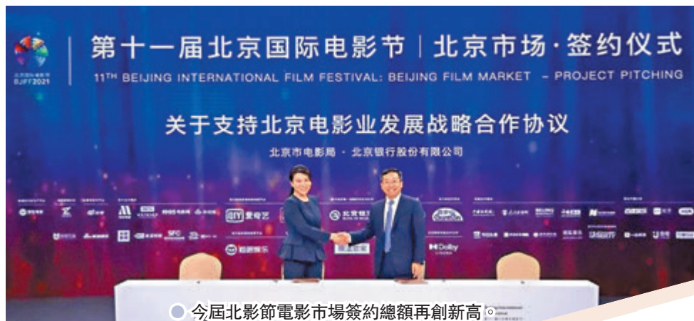
● 今屆北影節電影市場簽約總額再創新高。