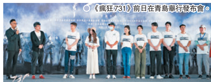
● 《瘋狂731》前日在青島舉行發布會。