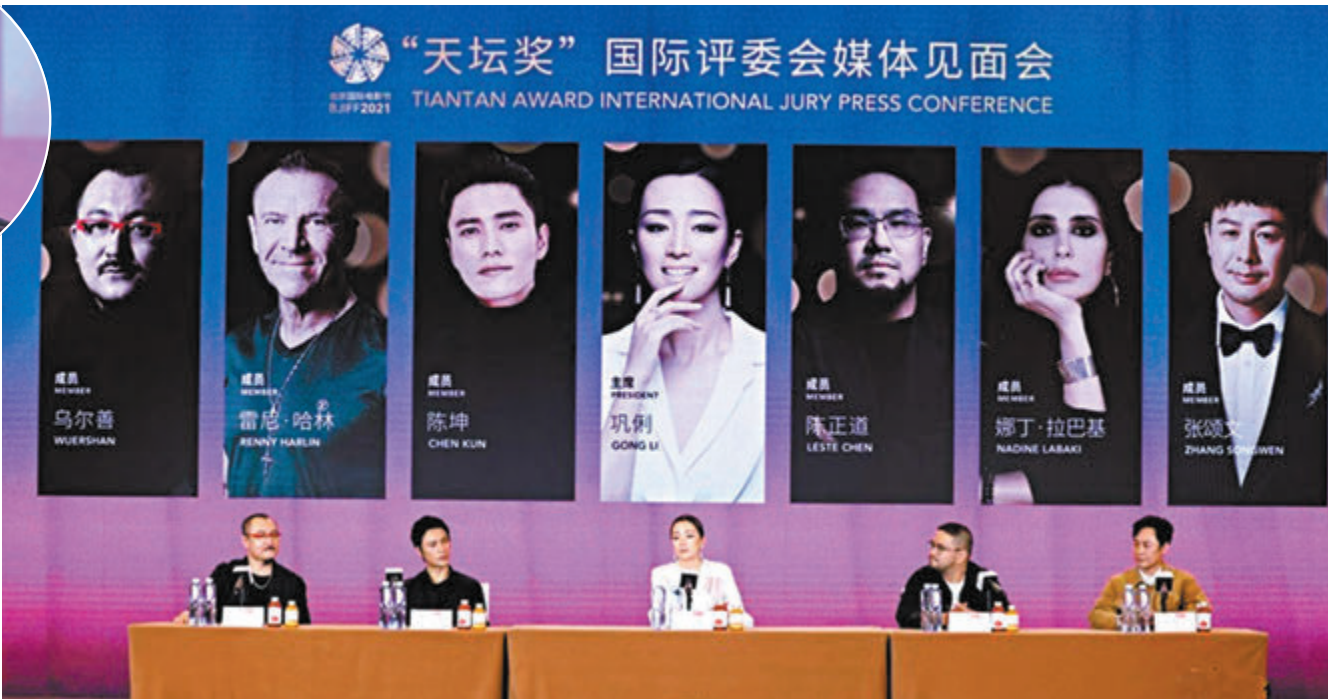
● 左起：烏爾善、陳坤、鞏俐、陳正道及張頌文在第十一屆北影節第二次評委會媒體見面會上亮相。