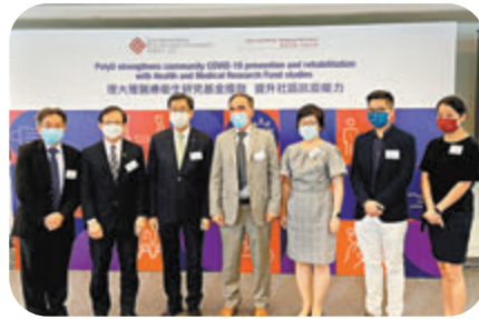
●理大獲政府醫療衛生研究基金的新一輪撥款，資助5,500多萬元開展新研究項目。

到場接種疫苗的袁伯伯今年已68歲，之前因高血壓而一直擔心打針後的副作用，「之前覆診時醫生已說不會有影響，今（昨）天到現場再次得到專業醫生的肯定，所以有信心。」89歲的陸婆婆昨日由女兒陪伴前來打針，她的6名子女已全部打完兩劑疫苗，「之前住得太遠所以一直無去打，今次醫生專門入社區為我們打，覺得十分方便。」78歲的丘婆婆與李婆婆相伴前來，「我們平時也一起做晨運，今（昨）日知道工聯會這個活動，便相約一起前來。打完可以約多人一起食飯了！」