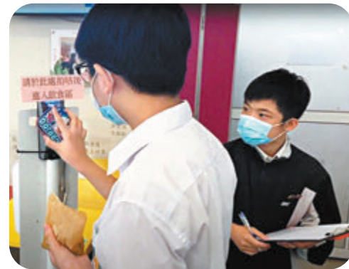
●學生進入飲食區前需要拍卡以作記錄。

香港特區政府教育局早前放寬恢復全日面授課堂的規定，12歲至17歲學生如已接種第一劑疫苗足14天、並達全校人數七成，即可向教育局申請恢復全日面授課。教育局局長楊潤雄上周曾表示，截至本月20日為止，31所學校申請恢復全日面授課堂，其中兩所申請全校所有班級恢復全日面授。