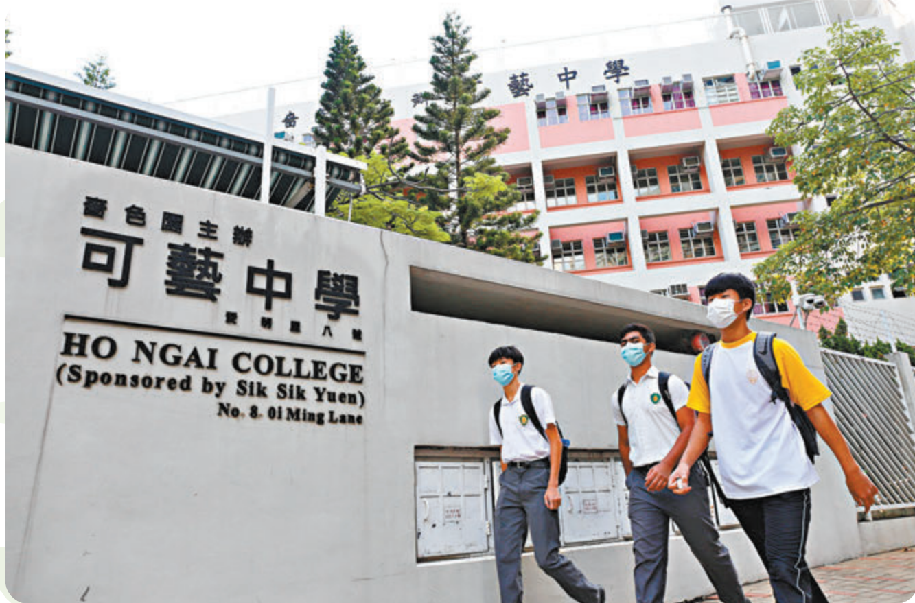
●可藝中學成為全港首間全校恢復全日面授課的本地課程學校。