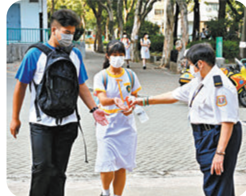
●學生入校前雙手需要噴消毒液消毒。