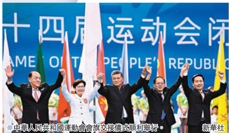
●中華人民共和國運動會會旗交接儀式順利舉行。