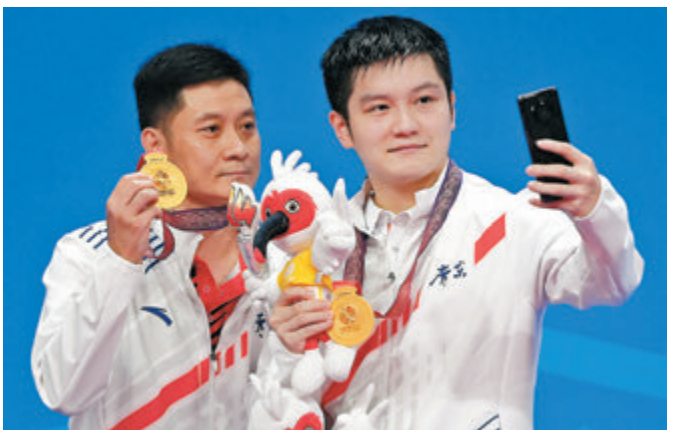
●樊振東(右)和教練李鵬民在頒獎儀式上合影。

樊振東曾說：「中國乒乓球之所以能長盛不衰，是因為每個時代都有人敢站出來，承擔屬於自己的一份責任。」如今，面對僅有三年的巴黎奧運備戰周期，國乒男隊的傳承將落在樊振東肩上。面對是否有信心接任「國乒領軍人」的關切，樊振東清醒且謙虛，「身份的轉變不是以個人意志為轉移。下一個周期我還是一個去拚、衝擊的角色。很多東西做到了，慢慢就擔起來了。」