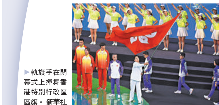
▶執旗手在閉幕式上揮舞香港特別行政區旗。