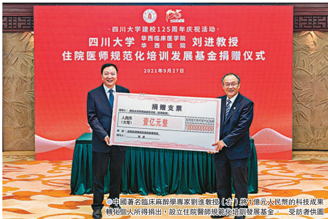
●中國著名臨床麻醉學專家劉進教授(右)將1億元人民幣的科技成果轉化個人所得捐出,設立住院醫師规范化培訓發展基金。

在即將退休的劉進看來,儘管有人會說1億元不是個小數目,對一個家庭也是一筆不菲的財富,但他和家人都認為,這筆錢用於家庭去過更為舒適的退休生活,是一種浪費,「而捐贈給住院醫師规范化培訓的事業,更具有社會意義,更能體現我們的人生價值。」