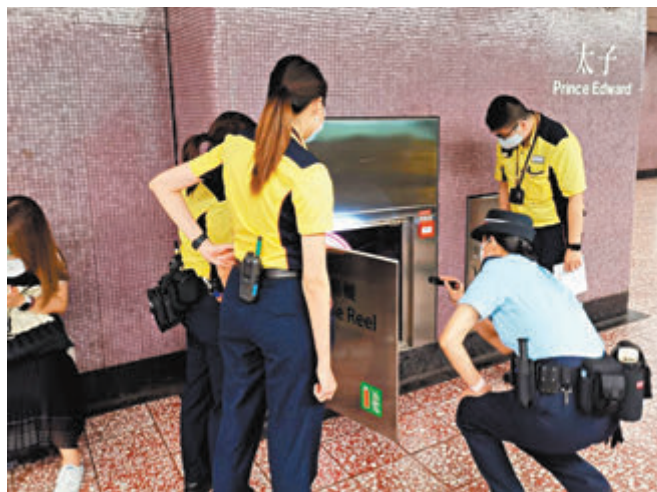
●鐵路警員及港鐵職員在港鐵站內聯合搜查危險品。