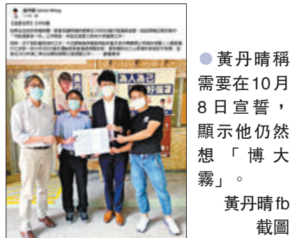
●黃丹晴稱需要在10月8日宣誓，顯示他仍然想「博大霧」。黃丹晴fb截圖