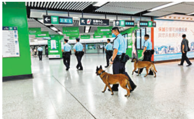
●警方高姿態巡邏港鐵鐵路系統。

為保障國慶節安全，警方高度重视，一連兩日（9月30日至10月1日）動員逾8,000名警力於港九各區進行部署，以確保升旗儀式、國慶酒會及各