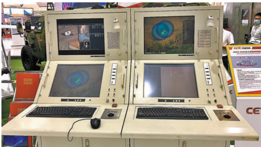
●UCCS-3000無人機指揮控制系統。

香港文匯報訊(記者 方俊明、盧靜怡、黃寶儀、帥誠 珠海報道)正在珠海舉行的第十三屆中國航展上,國產「天穹」綜合反無人機作戰體系首度亮相,反無作戰能力全面覆蓋「旋翼無人機自殺式襲擊」、「小型無人機集群攻擊」、「小型無人機集群和巡航導彈協同」、「中大型無人機偵察襲擾」、「察打一體無人機空襲」等來襲目標。該系統也是中國首套出口型綜合反無人機指揮系統,實現探測無人化、打擊智能化,縮短從探測到打擊指揮鏈,提升快速反應能力。