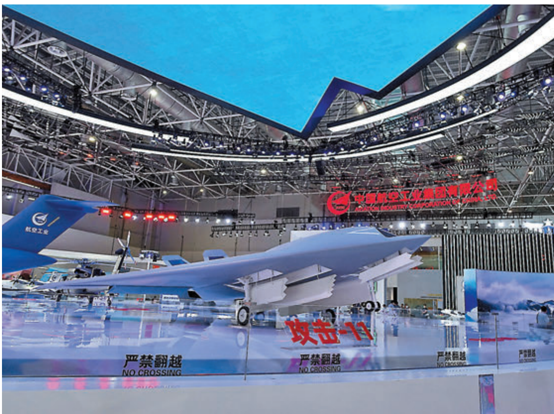
●攻擊-11隱形無人機首次亮相,它又被稱為「殲20的黃金搭檔」。