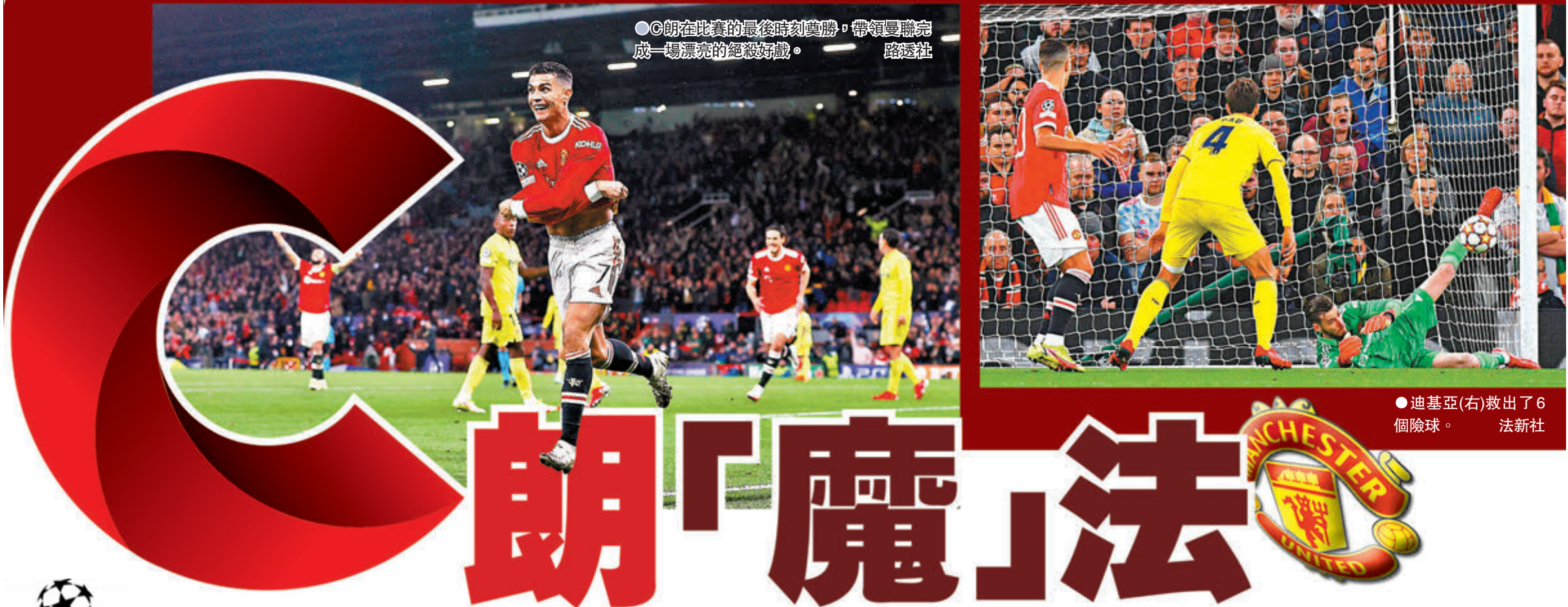
●C朗在比賽的最後時刻奠勝，帶領曼聯完成一場漂亮的絕殺好戲。