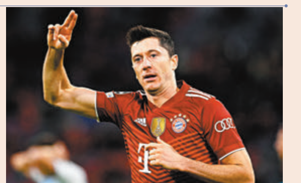
●利雲度夫斯基射入12碼先下一城。