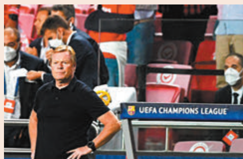
●朗奴高文甚感無奈。