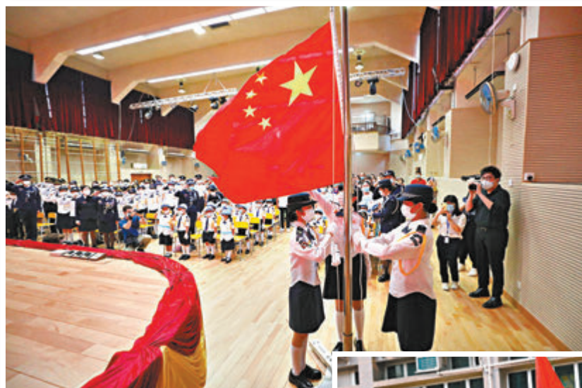
▲東涌黃楚標中學國慶日舉行升旗儀式。