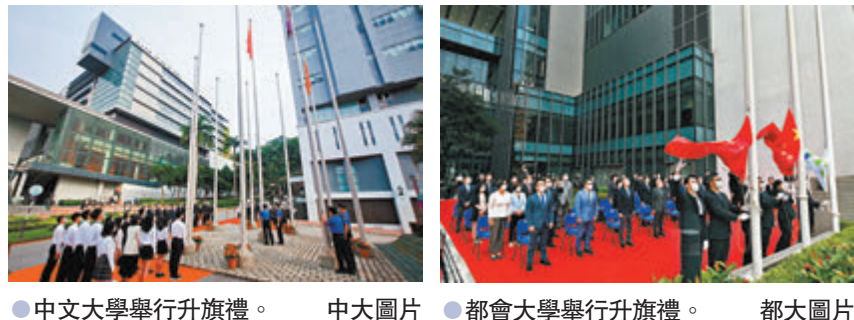
●中文大學舉行升旗禮。中大圖片 ●都會大學舉行升旗禮。都大圖片