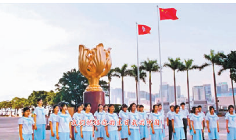
●黃楚標中學與內地姊妹學校惠州市第八中學合作拍攝的《今天是你的生日》MV截圖。圖為黃楚標中學學生。