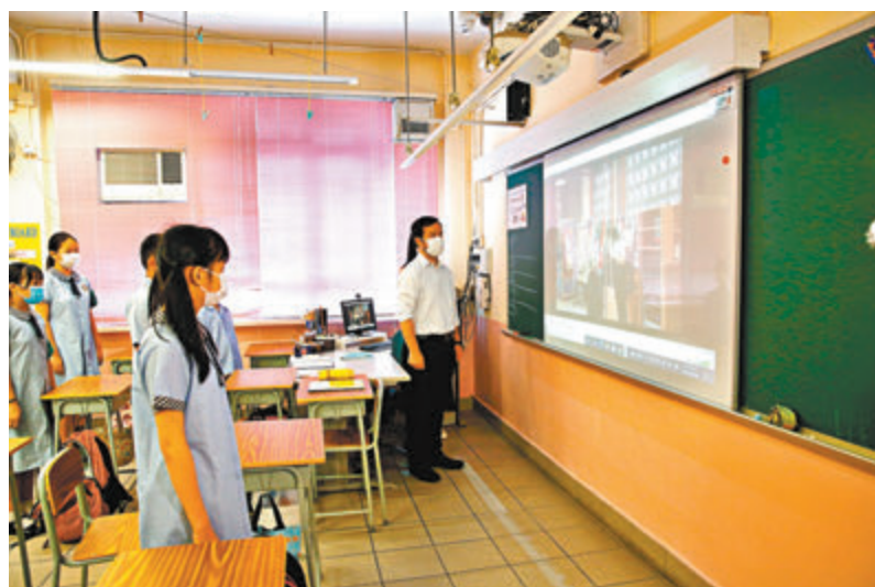
●香港鮮魚行學校的師生在教室觀看旗手升旗。

的高度。「縱使我們的旗杆受客觀條件所限，可能沒那麼『大氣』，但是我們尊重國旗的信念一點也不少！」施校長用言傳身教，把「國旗神聖」的信念植根於學生心中。