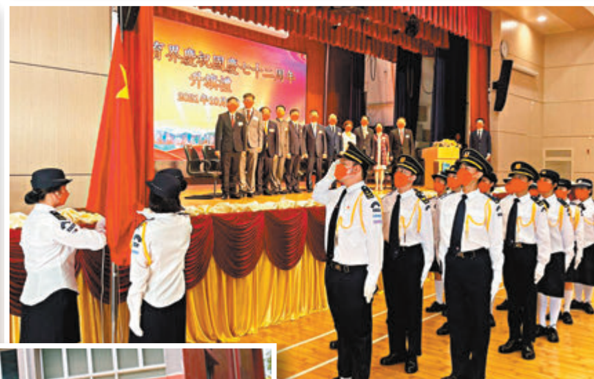
▲路德會西門英才中學舉行國慶升旗禮。