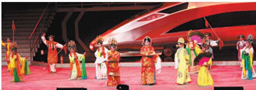
●粵劇小演員粉墨登場，唱做俱佳，令觀眾掌聲不絕。