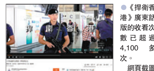
●《捍衛香港》廣東話版的收看次數已超過4,100多次。 網頁截圖

飛作詞。該MV的畫面穿插不少修例風波期間警方執法的畫面。在MV尾段，一眾香港警員以普通話高呼「我們是香港警察」。《捍衛香港》的廣東話及普通話版歌詞雖然有所不同，但同樣充分反映出香港警隊忠誠勇毅、無畏無懼維持法紀保護市民的精神。