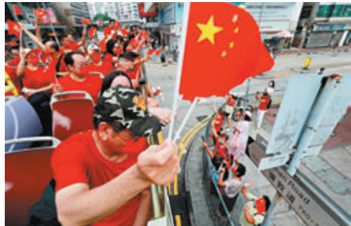
▲車上參加者不停揮動國旗和區旗，向沿路的市民和商店人員揮手打招呼。