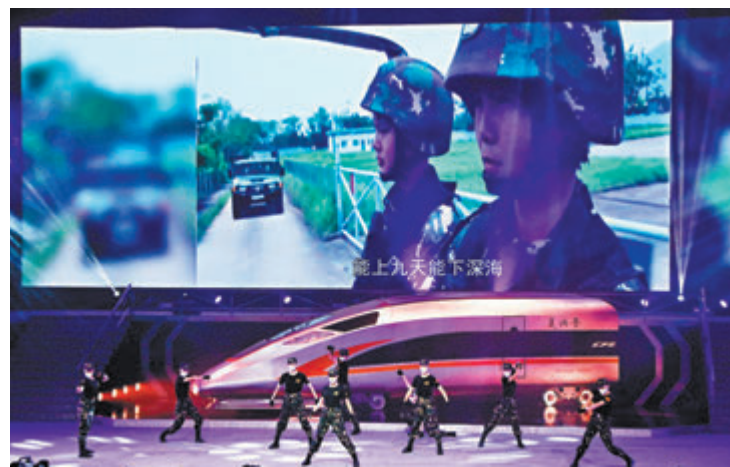
●解放軍駐港部隊文工團帶來精彩的歌舞演出。