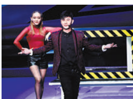
●魔術表演精彩無比。