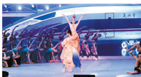
●舞劇《鳳凰于飛》讓觀眾領略少數民族的風采。