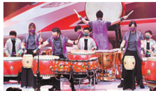
●氣勢如虹鼓樂聲演繹大國擔當。