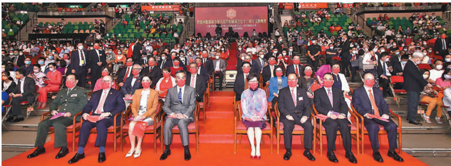
●「香港同胞慶祝中華人民共和國成立72周年文藝晚會」昨晚在紅磡體育館進行。

解放軍駐港部隊文工團亦獻上歌曲《不忘初心》及歌舞《香江礪劍》，向中國共產黨百年黨慶獻禮，相信黨會繼續帶領國家走進新時代。在壓軸環節中，眾演出嘉賓與團體同聲獻唱《歌唱祖國》，以歌聲頌讚祖國，亦為今年晚會畫上完美句號。