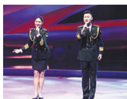
●解放軍駐港部隊文工團獻上歌曲《不忘初心》。