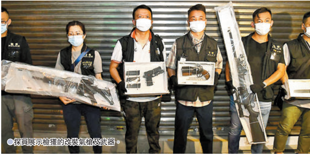
●探員展示檢獲的改裝氣槍及武器。

第二宗槍械案。上月18日，有組織罪案及三合會調查科探員搜查一名18歲浸大生位於將軍澳寓所及其租用的觀塘一間迷你倉儲物櫃，共檢獲9個軍用級防毒面具及6個濾罐、5支長槍及6支短槍的仿製槍械、兩部對講機、兩支伸縮