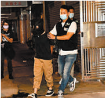
▲▼涉案夫婦被探員黑布蒙頭鎖上手銬押走。

棍、兩把摺刀、3個V煞面具及護具等證物，相信部分槍械發射功能可能超出兩焦耳法定限制。探員同時拘捕該名浸大生的46歲父親、41歲母親及14歲妹妹，正追查涉案物品的流向及使用目的，以及是否在黑暴案中被使用。