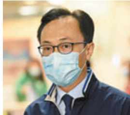
▲聶德權稱長者接種新冠疫苗是有需要及安全。資料圖片