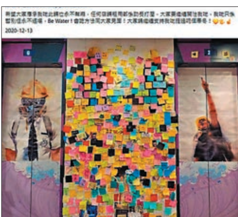
●有黃店店主被拒絕續約後，在fb發帖批鬥業主，更要求網民杯葛有關舖位。 fb截圖

該幫襯？」為題嘍「連登」發帖，列出10多間已執笠或搬遷嘅黃店，拎個業主出嚟俾「手足」批鬥。