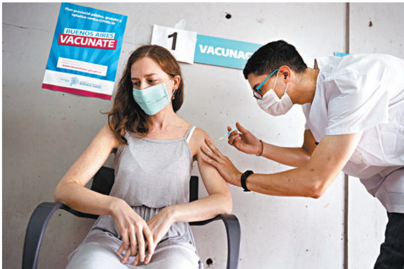
●今年6月，阿根廷衛生部批准康希諾生物股份公司新冠疫苗在阿根廷的緊急使用許可。圖為阿根廷醫務人員為教師接種中國新冠疫苗。資料圖片

在此次全球同步採訪中，新華社記者深切體會到，消除「免疫鴻溝」，兌現將疫苗作為全球公共產品的鄭重承諾，中國一直在不斷前行。