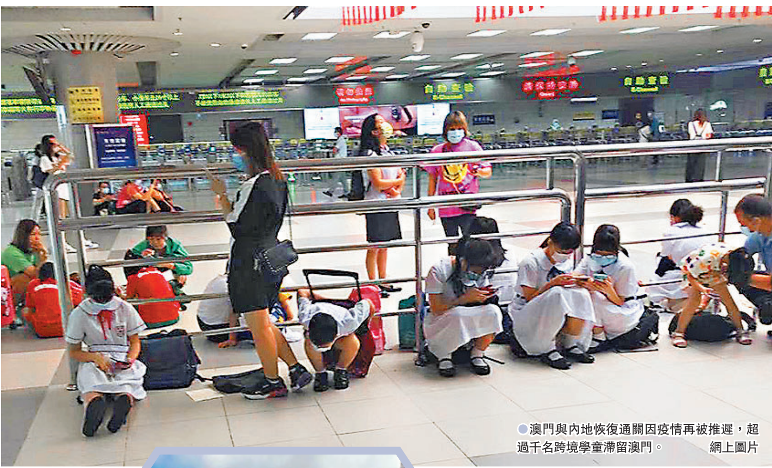
●澳門與內地恢復通關因疫情再被推遲，超過千名跨境學童滯留澳門。

有手信店人員表示，現時店內的營業額一般在數十元（澳門幣，下同）至三百幾元內，每個月十幾萬舖租「很難捱」，在國慶前兩日完全無生意，皆因沒有人流；又直言「之前食飯都叫個外賣，廠家外賣都食唔起，要食腐乳送飯」。亦有手信店負責人稱，黃金周無生意，現時只希望盡快通關後能增加市面人流，惟仍然擔憂未必有旅客訪澳。