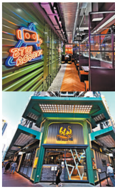
●餐廳裝潢走創新的工業風路線