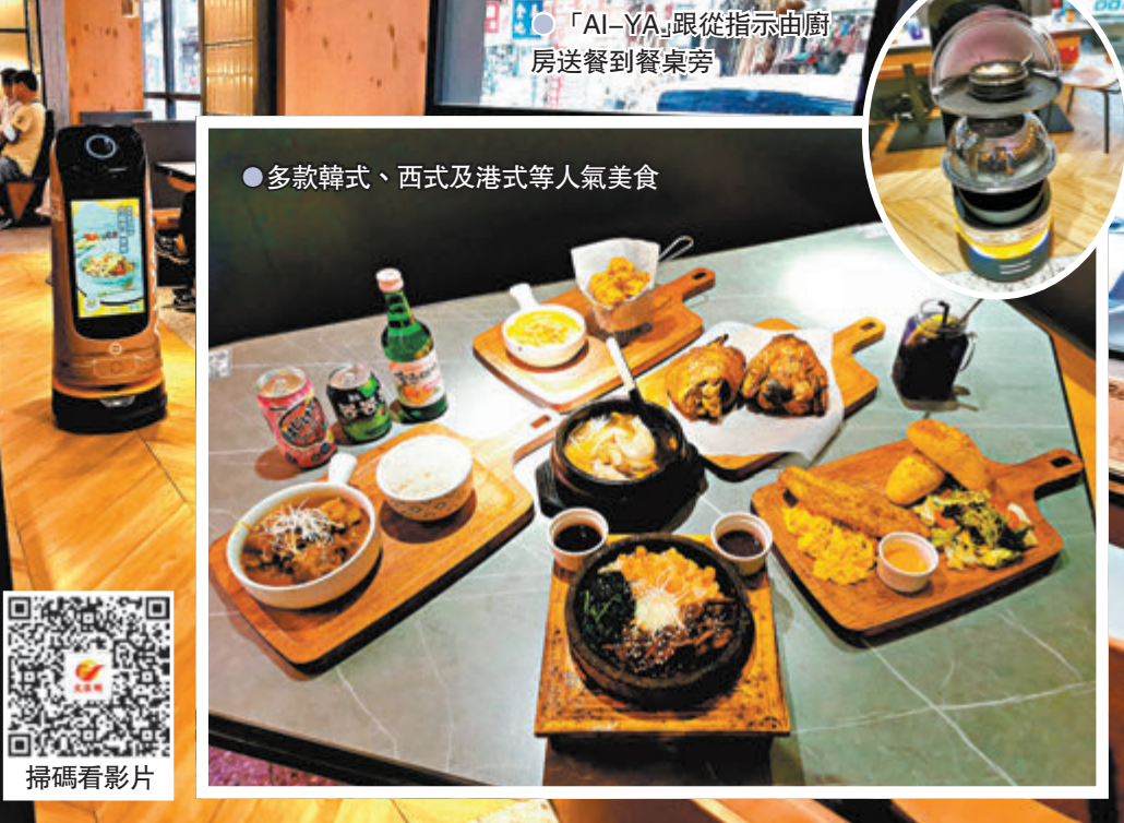
●多款韓式、西式及港式等人氣美食

自屯馬綫新站生瓜灣站開通後，帶動了土瓜灣的人流，這間嶄新「機械人餐飲服務」概念店「btw」便特地選在這兒開店，全店佔地逾2,400呎，環境寬敞，為食客提供舒適的用餐空間，並帶來新世代的餐飲體驗，當中最大特色就是場內特聘三位外形矚目的機械人練習生「AI-YA」，專責招待及送餐服務。店內主打韓式、西式及港式等多種人氣美食，以「your everyday meal」的理念設計菜單，食客從早到晚都可找到合心意的美食。自此，大家在區內覓食又多一個特色選擇。