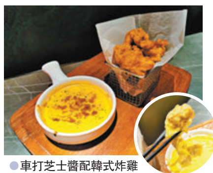
●車打芝士醬配韓式炸雞