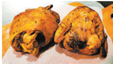
●滋味烤雞及脆烤豬手