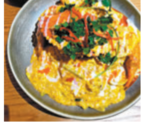
●泰式蛋咖喱炒原隻肉蟹$398、手抓餅及蒜蓉包