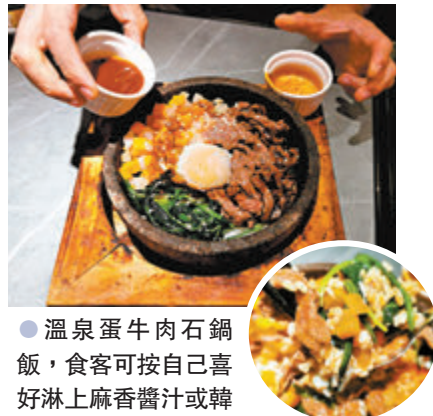
●溫泉蛋牛肉石鍋飯，食客可按自己喜好淋上麻香醬汁或韓式辣醬汁。