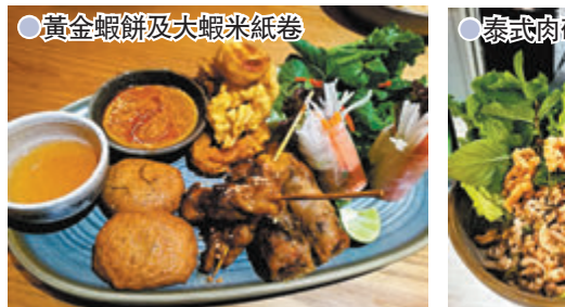
●黃金蝦餅及大蝦米紙卷