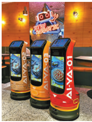
●全自動機械人練習生「AI-YA」

溫泉蛋牛肉石鍋飯($66)，推崇三部烹調的吃法，讓石鍋飯靜待約30秒，熱石鍋令白飯變得焦脆，再按喜好淋上少量麻香醬汁或韓式辣醬汁，最後將所有食材攪拌均勻，溫泉蛋的流心滲在嫩滑的牛肉上，米飯拌着溫泉蛋和牛肉的醬汁，再來一口清新的菠菜、一口清甜的蘿蔔粒，盛載着滿滿的幸福。而咖喱牛腩配珍珠飯($64)，具香味濃郁的馬來西亞風味，選用優質咖喱料配合30多種香料熬製而成的濃郁咖喱汁，再加入每日烹調6小時以上的秘製咖喱牛腩，香氣四溢；而牛腩則精挑坑腩部位，紋至軟腩入味，牛肉吸收所有香料風味，創造出其獨特多層次的口感及味道。當然，餐廳兩大外賣皇牌——滋味烤雞及脆烤豬手，每日新鮮現場烤製，一推出市場，即受食客歡迎，每日出爐時間前，都會出現人龍排隊購買。