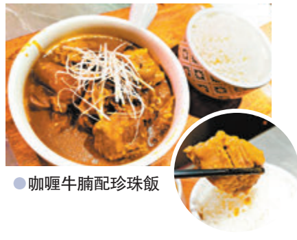
●咖喱牛腩配珍珠飯