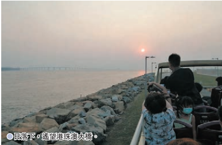
● 日落下，遙望港珠澳大橋。