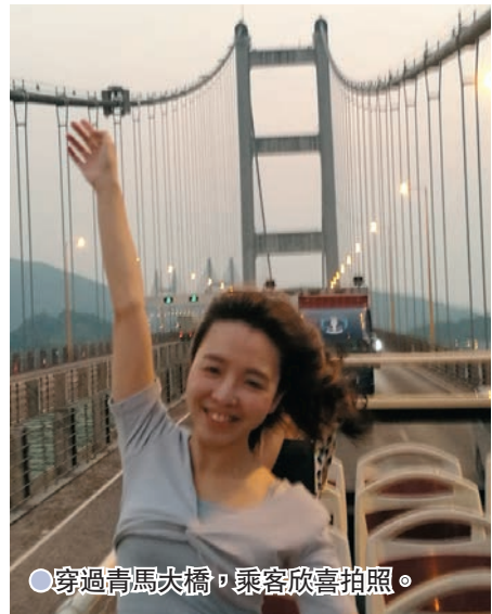
● 穿過青馬大橋，乘客欣喜拍照。

日當天在東涌纜車站售票處，憑即日來回纜車門票(標準或水晶車廂)，即可以優惠價$48升級至「360纜車·敞篷觀光巴士黃昏遊」套票，套票須於同日使用，巴士座位有限，額滿即止。