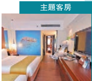
● 西澳州寧格魯珊瑚礁