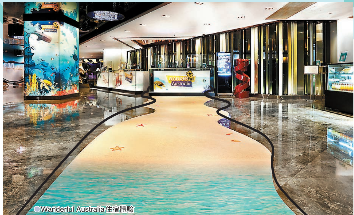
● Wanderful Australia住宿體驗

香港文華東方酒店與法國天然護膚品牌Chantecaille合作，由即日起至11月30日期間假酒店東側大堂攜手推出期間限定「Into the Wild野生動物保育展覽」，以珍貴照片展現不同的瀕危動物。為慶祝展覽開幕，酒店並推出「Chantecaille Into the Wild限時住宿計劃」，賓客可專享奢華住宿、參與「微型森林工作坊」，以及獲贈Chantecaille專屬禮品及各項禮遇。展覽打造成印度野生叢林，讓賓客親歷印度稀有和神秘貓科動物皇家孟加拉虎和印度花豹的生活環境。屆時，賓客可透過品牌的「Wild Beauty」AR手機應用程式，於現實中與不同的瀕危野生動物拍照互動。