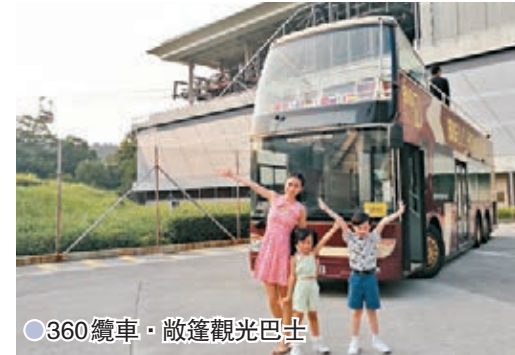
● 360纜車·敞篷觀光巴士