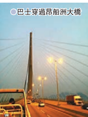
● 巴士穿過昂船洲大橋