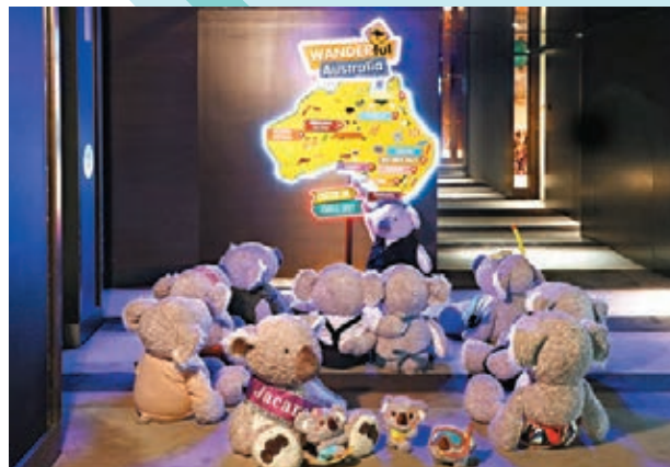
● 專屬主題樓層體驗

現在，大家未能外遊，不少人都記掛着旅行，因此有酒店特將房間布置融入旅遊景點元素，如位於尖沙咀的型格生活設計酒店 The Mira Hong Kong 便與澳洲旅遊局等攜手，由即日起至11月14日推出Wanderful Australia探尋非凡「澳」秘之旅，以嶄新生活概念打造主題住宿、水療與饕餮饗賞，讓大家在香港可肆意感受澳洲動人心弦的景點與體驗。這旅程由WANDERful探尋非凡「澳」秘之旅、WINEderful醇酒醉人「澳」妙、FEASTiful滋味「澳」秘與SPAtiful悠然水療「澳」妙組成，讓大家透過住宿、享樂、美酒、盛宴盡情體驗，型格「澳」遊。而且，住主題房還可以免費享用在17樓的Wanderland環球樂園的遊戲設施，實行多重玩樂享受。