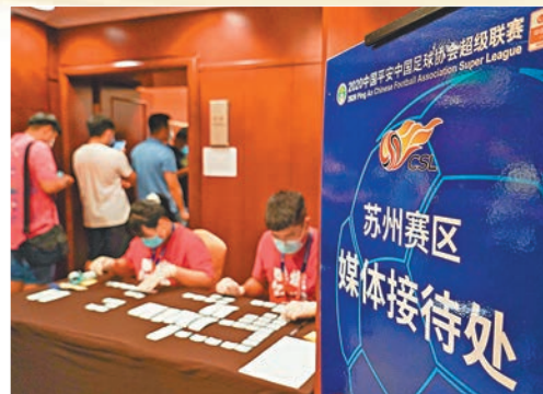
●蘇州賽區早有在疫情下主辦比賽經驗。

由於疫情等多項原因,國足在10月兩場12強賽只能在沙迦的中立場舉行,消息指國足完成本輪對越南和沙特阿拉伯的比賽後,將會在10月13日返國進行調整,並到蘇州賽區接受隔離。由於按賽程國足於11月會有兩場主場比賽,據報各方面正積極進行協調,如果相關方案最終獲得有關部門和國際足協通過,那國足將有望在蘇州出戰對阿曼和澳洲的12強賽,而蘇州賽區目前據報已開