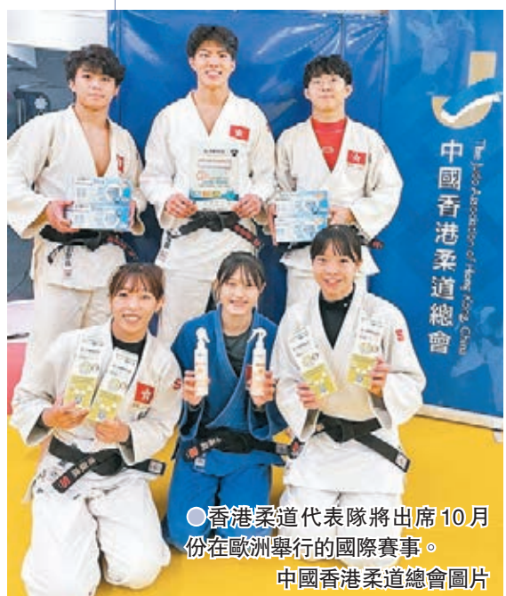
●香港柔道代表隊將出席10月份在歐洲舉行的國際賽事。

中國香港柔道總會主席黃寶基表示:「由於疫情的關係,港隊已經有超過一年半未有出外比賽。我們希望透過今次在歐洲一系列的賽事及集訓,讓運動員可以重拾狀態,為明年恢復到海外征戰作好準備。為了更好的保護運動員,這次到歐洲參加的賽事,我們挑選了一些疫情相對較穩定的地區,同時亦為運動員提供了防疫產品,希望他們可以安心爭取好成績。」