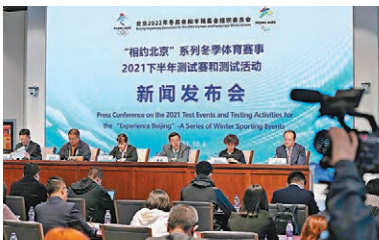
●北京冬奧組委針對競賽場館國際測試賽提出全要素測試要求。

場館國際測試賽提出了開展全要素測試的要求,即按照北京冬奧會賽時運行標準,全面制定落實疫情防控工作方案。賽事一項重要工作是疫情防控,按照「一場一策」、「一館一策」要求,各賽區組委會和場館團隊已細化功能分區、防疫分區、人員流線等,強化閉環管理安排。目前,各競賽場館閉環管理防疫方案已通過國家級防疫專家和組委會多輪審議,從衣食住行、訓練比賽、頒獎採訪、防疫消毒等各個環節,對可能出現的風險點都做了全面分析,制定相應預案。