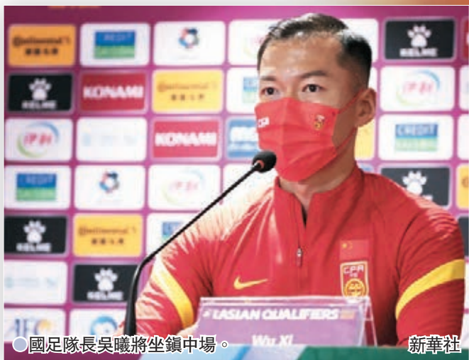
●國足隊長吳曦將坐鎮中場。