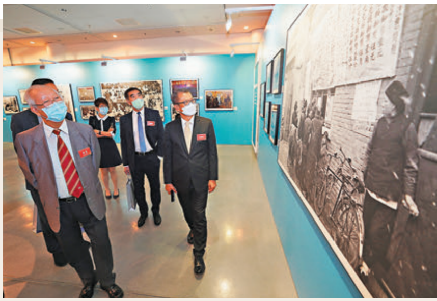
財政司司長陳茂波等嘉賓參觀展覽。