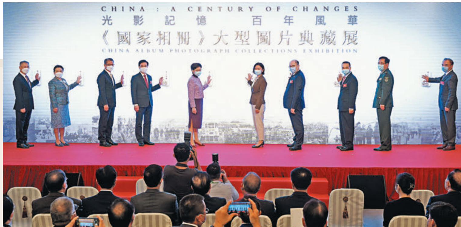
「光影記憶 百年風華——《國家相冊》大型圖片典藏展」在香港開幕。主禮嘉賓共同啓動圖片典藏展。