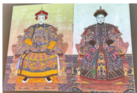
▲咸豐帝和孝欽皇后的肖像。