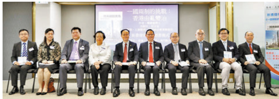
●傅健慈新書《一國兩制的挑戰：香港由亂變治》新書發布會暨贈書儀式昨日在香港舉行。

基本法委員會副主任譚惠珠、中聯辦法律部部長劉春華、立法會議員何君堯、香港文匯報總編輯吳明等出席了贈書儀式。