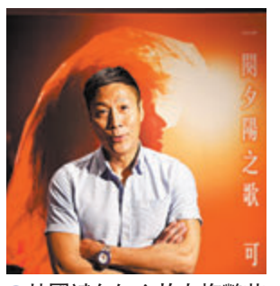
●林國斌向知心故友梅艷芳留言。