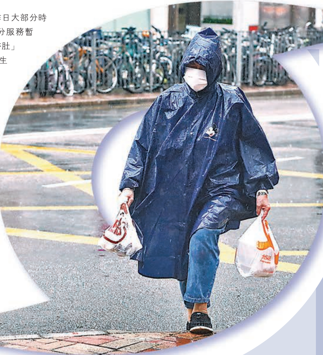
▲八號風球下，外賣員冒着狂風暴雨送外賣。 香港文匯報記者 攝