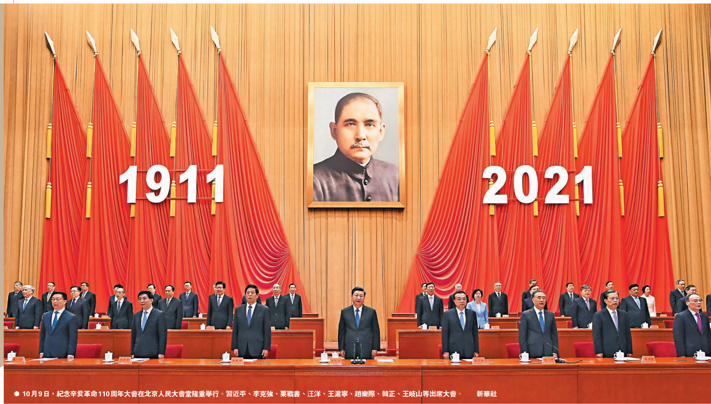
● 10月9日，紀念辛亥革命110周年大會在北京人民大會堂隆重舉行。習近平、李克強、栗戰書、汪洋、王滬寧、趙樂際、韓正、王岐山等出席大會。