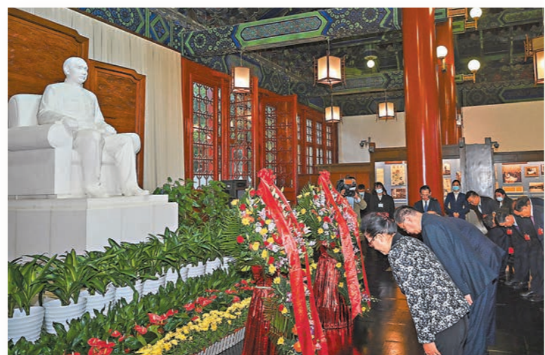
●10月9日，由辛亥革命先輩後裔、港澳同胞、台灣同胞和海外僑胞等代表組成的嘉賓參訪團前往北京中山公園中山堂拜謁。

動兩岸關係和平發展，是兩岸同胞的主流民意。「我們將繼續團結廣大台灣同胞堅守民族大義，站在歷史正確的一邊，共同完成祖國完全統一的歷史使命。台灣問題因民族弱亂而產生，必將隨着民族復興而解決。」