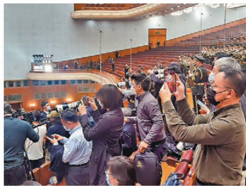
●中外記者們爭相拍攝報道紀念辛亥革命110周年大會。

總會記提到「實現中華民族偉大復興」以及引述當年孫中山先生提出民族、民權、民生的三民主義政治綱領，率先發出「振興中華」的吶喊，讓自己深有感觸，並感到內心振奮。在紀念辛亥革命110周年之際，除在此緬懷中山先生與辛亥革命先烈，也很光榮地身為中國先賢先烈們的誠摯敬意與感恩謝意。