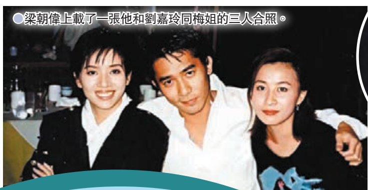
●梁朝偉上載了一張他和劉嘉玲同梅姐的三人合照。