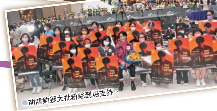
●胡鴻鈞獲大批粉絲到場支持。