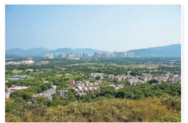
▲恒地於粉嶺北及古洞北新發展區內現有138萬方呎土地。圖為古洞北。