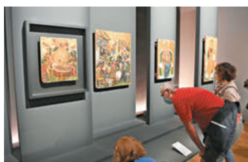
●繪畫作品也展現了希臘藝術的變化發展。