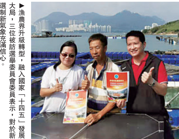
▲漁農界升級轉型，融入國家「十四五」發展大局，三位被訪選委委員表示，對於新選制新氣象充滿信心。