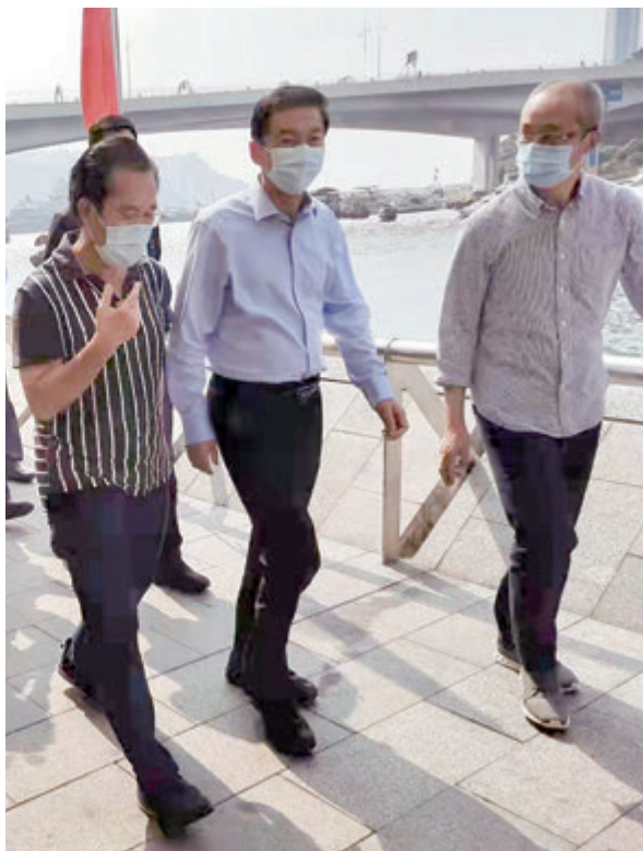
▲駱惠寧主任在漁船上與漁民交流。

(文/張童)九月底，香港中聯辦啓動「落區聆聽 同心同行」活動，中聯辦主任駱惠寧首站即走訪香港漁農界。在香港仔避風塘，他登上「新得利」號漁船並與漁民親切交談。駱惠寧表示，中央非常關心香港漁業發展，不久前出台《港澳流動漁船漁民管理規定》，當中不少政策都具突破性，故他殷切希望香港漁業界能用好國家政策，打造現代化漁業。對談漁民則稱，過去香港漁業已成夕陽行業，沒有年輕人願意進來，如今，香港漁業在內地找到了發展新方向，許多年輕人也因看到發展空間，願意回流。