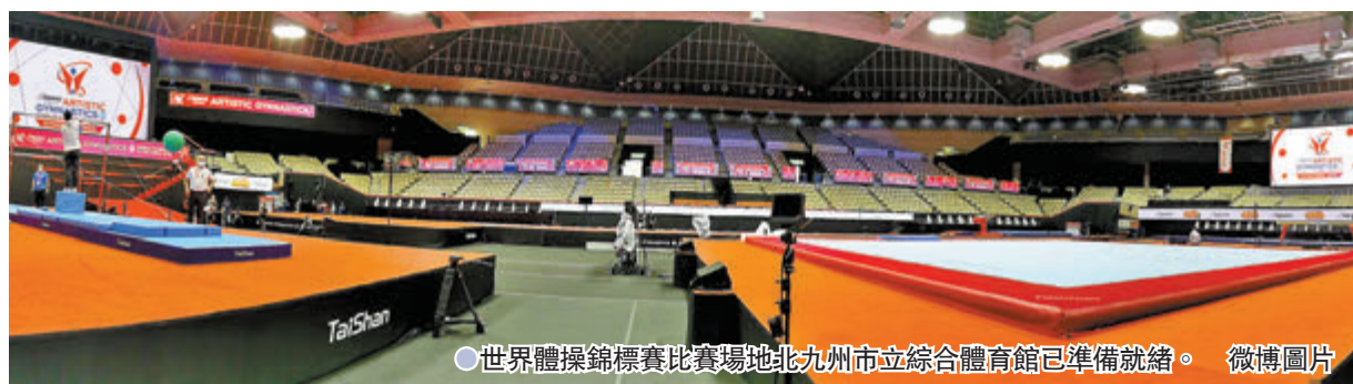
●世界體操錦標賽比賽場地北九州市立綜合體育館已準備就緒。