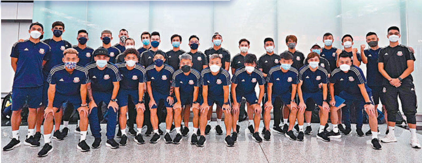
●理文昨日凌晨起程前赴烏茲別克塔什干。

香港文匯報訊(記者 黎永淦)下周三出戰2021亞協盃跨區決賽的理文,昨日凌晨起程,先取道韓國再轉機到烏茲別克塔什干。據早一日抵埗的先頭部隊透露,在當地下榻酒店遇過不戴口罩的住客。為安全起見,球隊早已定下防疫指引,職、球員必須時時佩戴口罩之餘,也不許獨自離開酒店範圍。(NowTv633台下周三晚上9時正將會直播這場大戰)。