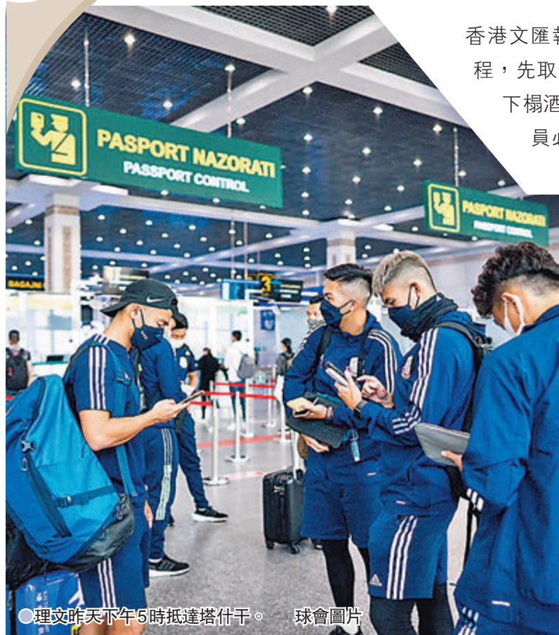
●理文昨天下午5時抵達塔什干。

香港文匯報訊(記者 黎永淦)下周三出戰2021亞協盃跨區決賽的理文,昨日凌晨起程,先取道韓國再轉機到烏茲別克塔什干。據早一日抵埗的先頭部隊透露,在當地下榻酒店遇過不戴口罩的住客。為安全起見,球隊早已定下防疫指引,職、球員必須時時佩戴口罩之餘,也不許獨自離開酒店範圍。(NowTv633台下周三晚上9時正將會直播這場大戰)。