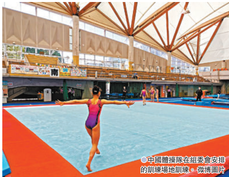
●中國體操隊在組委會安排的訓練場地訓練。 微博圖片